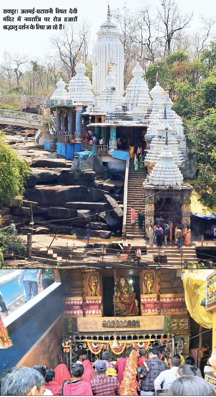
रायपुर। जतमई-घटारानी स्थित देवी मंदिर में नवरात्रि पर रोज हजारों श्रद्धालु दर्शन के लिए जा रहे हैं।

उत्तरकाशी, 26 मार्च। उत्तरकाशी के उत्तरकाशी में शनिवार रात को बिजली गिरने से 350 से ज्यादा भेड़-बकरियों की मौत हो गई। मीडिया रिपोर्ट्स के मुताबिक, भटवाड़ी ब्लॉक के बारसू गांव के तीन लोग अपनी हजार से ज्यादा भेड़-बकरियों को ऋषिकेश से उत्तरकाशी लेकर जा रहे थे। रात को वे डुंडा तहसील के खडखाल के पास पहुंचे थे। इस दौरान लगातार बारिश हो रही थी और तेज आंधी चल रही थी। रात करीब 9 बजे बिजली गिरी और उसकी चपेट में आने से 350 से ज्यादा भेड़-बकरियों की मौत हो गई।