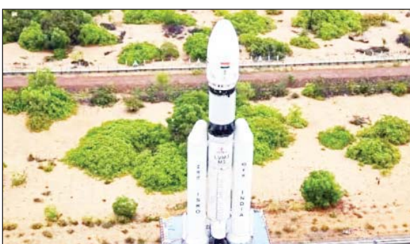
साथ ले गया 36 सैटलाइट

श्रीहरिकोटा, 26 मार्च। भारतीय अंतरिक्ष अनुसंधान संगठन ने एक बड़ी सफल लॉन्चिंग की है। रविवार को श्रीहरिकोटा स्थित सतीश धवन अंतरिक्ष केंद्र से देश का सबसे बड़ा रॉकेट LVMx लॉन्च किया गया। खास बात यह है कि यह रॉकेट अपने साथ 36 सैटलाइट लेकर गया है। यह रॉकेट रविवार सुबह 9 बजे लॉन्च किया गया। इसके लिए एक दिन पहले ही काउंटडाउन शुरू कर दिया गया था। दृस्त्रह के मुताबिक यह रॉकेट पृथ्वी की 450 किलोमीटर सर्वलर ऑर्बिट 36 वनवेब जेन-1 सैटलाइट स्थापित करेगा जिनका