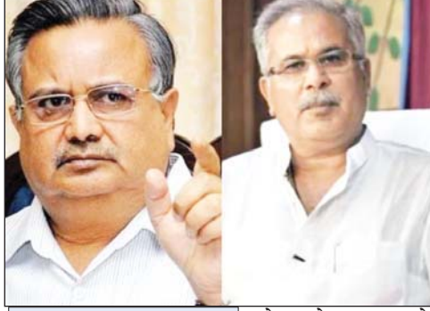
मुख्यमंत्री ने कहा- ये केमिकल लोचा है

मुख्यमंत्री भूपेश बघेल ने कहा- किलोमीटर के हिसाब से एसईसीएल खदान के भीतर ट्रांसपोर्टेशन के लिए रेट निर्धारित है। जब पिछली सरकार में टेंडर किया गया और नियम बनाया गया उसी समय ये कह दिया जाता कि गाईडलाइन के हिसाब से परिवहन होगा, लेकिन साल 2017 में तो आपने ऐसा किया नहीं। जब आप मुख्यमंत्री थे तब आपने जो नियम बनाया वहीं है। अलग-अलग खदानों के लिए अलग-अलग रेट आता है। रमन सिंह ने कहा- एसईसीएल ने नोटिफिकेशन जारी किया है इसे लेकर कोल ट्रांसपोर्टिंग के लिए एसईसीएल मापदंड तय करता है। एसईसीएल जब गाईडलाइन तय कर चुका है, फिर छत्तीसगढ़ का उपक्रम क्यों रेट तय करेगा। प्रति मेट्रिक टन 210 रुपये से ज्यादा की अतिरिक्त वसूली हुई है। करोड़ों की गड़बड़ी ट्रांसपोर्टिंग का रेट बढ़ाकर किया गया है। क्या टेंडर को निरस्त किया जाएगा? सीएम भूपेश