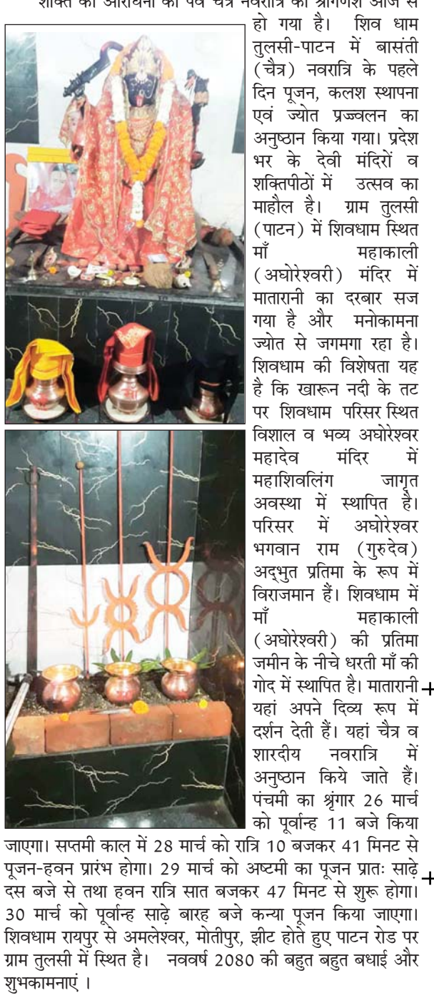
शक्ति की आराधना का पर्व चैत्र नवरात्रि का श्रीगणेश आज से हो गया है। शिव धाम तुलसी-पाटन में बासंती (चैत्र) नवरात्रि के पहले दिन पूजन, कलश स्थापना एवं ज्योत प्रज्वलन का अनुष्ठान किया गया। प्रदेश भर के देवी मंदिरों व शक्तिपीठों में उत्सव का माहौल है। ग्राम तुलसी (पाटन) में शिवधाम स्थित माँ महाकाली (अघोरेश्वरी) मंदिर में मातारानी का दरबार सज गया है और मनोकामना ज्योत से जगमगा रहा है। शिवधाम की विशेषता यह है कि खारून नदी के तट पर शिवधाम परिसर स्थित विशाल व भव्य अघोरेश्वर महादेव मंदिर में महाशिवलिंग जागृत अवस्था में स्थापित है। परिसर में अघोरेश्वर भावान राम (गुरुदेव) अद्भुत प्रतिमा के रूप में विराजमान हैं। शिवधाम में माँ महाकाली (अघोरेश्वरी) की प्रतिमा जमीन के नीचे धरती माँ की गोद में स्थापित है। मातारानी यहां अपने दिव्य रूप में दर्शन देती हैं। नवरात्रि व शारदीय नवरात्रि में अनुष्ठान किये जाते हैं। पंचमी का श्रृंगार 26 मार्च को पूर्वाह्न 11 बजे किया जाएगा। सप्तमी काल में 28 मार्च को रात्रि 10 बजकर 41 मिनट से पूजन-हवन प्रारंभ होगा। 29 मार्च को अष्टमी का पूजन प्रातः साढ़े दस बजे से तथा हवन रात्रि सात बजकर 47 मिनट से शुरू होगा। 30 मार्च को पूर्वाह्न साढ़े बारह बजे कन्या पूजन किया जाएगा। शिवधाम रायपुर से अमलेश्वर, मोतीपुर, झीट होते हुए पाटन रोड पर ग्राम तुलसी में स्थित है। नववर्ष 2080 की बहुत बहुत बधाई और शुभकामनाएं।