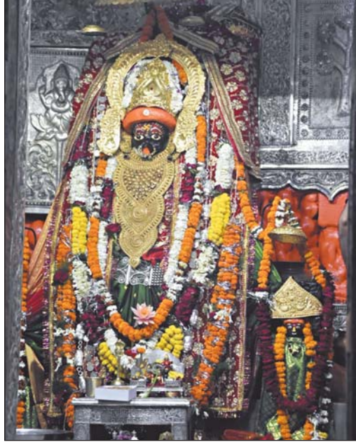
रायपुर 22 मार्च। ऐतिहासिक महामाया मंदिर में आज नवरात्रि के पहले दिन ज्योत प्रज्ज्वलित किए गए। माता रानी के दर्शन करने सुबह से श्रद्धालुओं की कतार लगी रही।