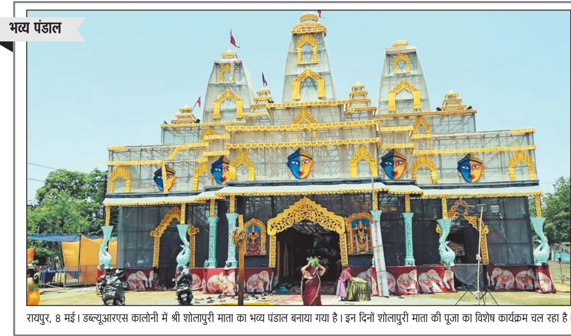
रायपुर, 8 मई। डब्ल्यूआरएस कालोनी में श्री शोलापुरी माता का भव्य पंडाल बनाया गया है। इन दिनों शोलापुरी माता की पूजा का विशेष कार्यक्रम चल रहा है।