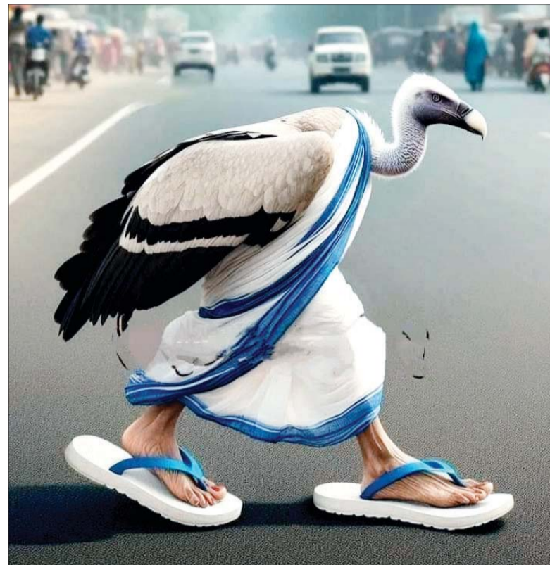
चल उड़ जा रे पंछी.... कि अब ये, देश हुआ बेगाना.....

किए जाने की बात सामने आई है। आरोपियों ने कथित तौर पर कैंप और आसपास के इलाके के वीडियो बनाकर पाकिस्तान में बैठे हैडलर्स को भेजे थे। सूत्रों के अनुसार, उत्तर प्रदेश के कुछ पुलिस थाने भी मॉड्यूल के निशाने पर थे। स्पेशल सेल अब गिरफ्तार आरोपियों से पूछताछ के आधार पर मॉड्यूल के अन्य नेटवर्क, फंडिंग और सीमा पार संपर्कों की जांच कर रही है।