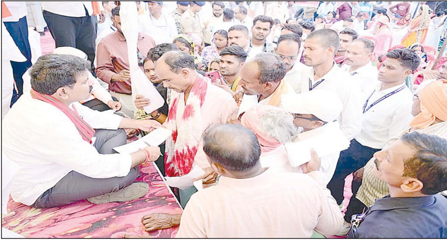
आवास सिर्फ एक मकान नहीं होता, बल्कि वर्षों से देखे गए उस सपने का साकार रूप होता है, जहां

कवर्धा, 8 मई। कबीरधाम जिले के ग्राम पंचायत बम्हनी में आयोजित सुशासन तिहार का समाधान शिविर गुरुवार को ग्रामीणों के लिए सीधे संवाद का मंच बन गया। उप मुख्यमंत्री विजय शर्मा ने यहां जमीन पर बैठकर लोगों की समस्याएं सुनीं। जहां बड़ी संख्या में ग्रामीण अपने आवेदन लेकर पहुंचे थे। उप मुख्यमंत्री ने सभी की बात ध्यान से सुनते हुए संबंधित अधिकारियों को मौके पर ही निराकरण के निर्देश दिए। उन्होंने कहा कि समाधान शिविर शासन, प्रशासन और आमजन के बीच का सेतु है। लोगों की समस्याओं का त्वरित समाधान हो यह प्रयास होना चाहिए। ग्राम पंचायत बम्हनी में 24 गांवों के क्लस्टर को शामिल करते हुए शिविर आयोजित किया गया। इस दौरान उप मुख्यमंत्री ने प्रधानमंत्री आवास योजना का उल्लेख करते हुए कहा कि किसी परिवार के लिए पीएम