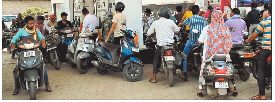
रायपुर, 14 मई। पर्याप्त मात्रा में पेट्रोल की आपूर्ति नहीं होने तथा पेट्रोल की किल्लत की आशंका में पंपों में वाहनों की लंबी लाइन लगने लगी है। आज भी कई पंप बंद रहे। जहां पेट्रोल था वहां राशनिंग कर दी गई थी।