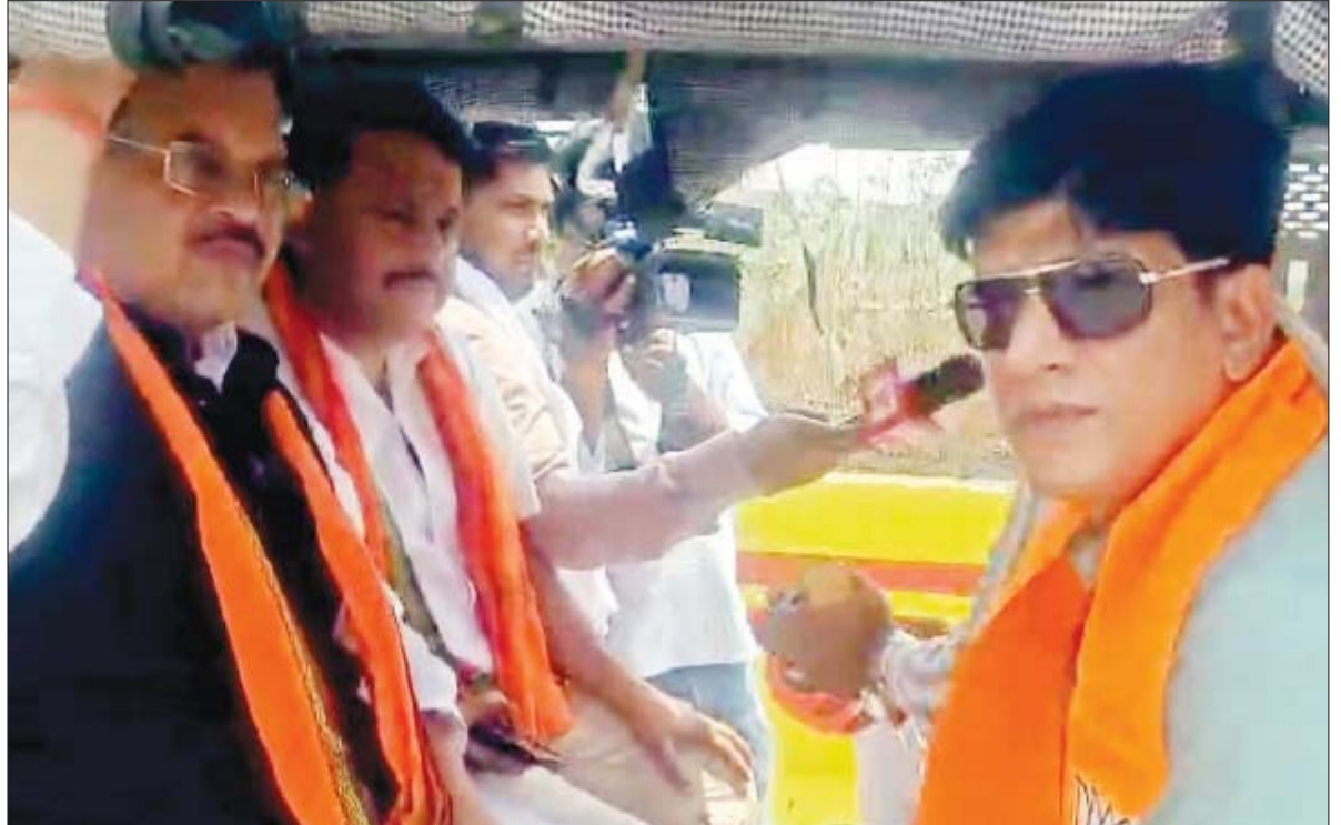
रायपुर। प्रधानमंत्री नरेन्द्र मोदी की अपील के बाद भाजपा नेता ईवी आटो रिक्शा का उपयोग करने लगे हैं। भाजपा प्रदेश कार्यसमिति की बैठक में शामिल होने भाजपा प्रवक्तागण बैटरी चलित वाहन से भाजपा कार्यालय पहुंचे।