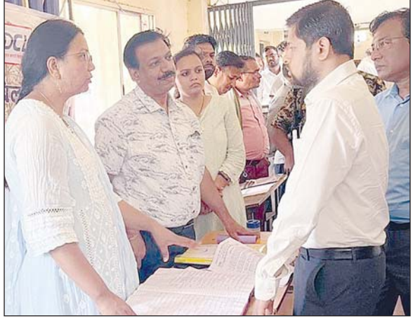
कुल 16 करोड़ 97 हजार 546 रुपए का बकाया था। योजना के

भिलाई, 12 मई। मुख्यमंत्री बिजली बिल भुगतान समाधान योजना बिजली उपभोक्ताओं के लिए राहतभरी साबित हो रही है। छत्तीसगढ़ स्टेट पावर डिस्ट्रीब्यूशन कंपनी में 8 मई तक 21 हजार 543 सक्रिय उपभोक्ताओं ने योजना का लाभ लेते हुए 1 करोड़ 89 लाख 56 हजार रुपए से अधिक की बकाया राशि जमा की है। जानकारी के अनुसार 31 मार्च 2023 तक दुर्ग क्षेत्र में 30 हजार 666 सक्रिय उपभोक्ता योजना के लिए पात्र पाए गए थे जिन पर कुल 16 करोड़ 97 हजार 546 रुपए का बकाया था। योजना के