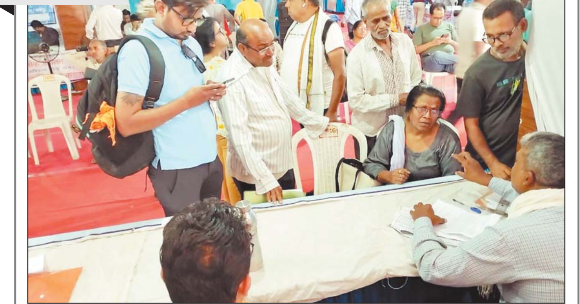
रायपुर, 9 मई। आज जिला न्यायालय में नेशनल लोक अदालत का आयोजन किया गया।