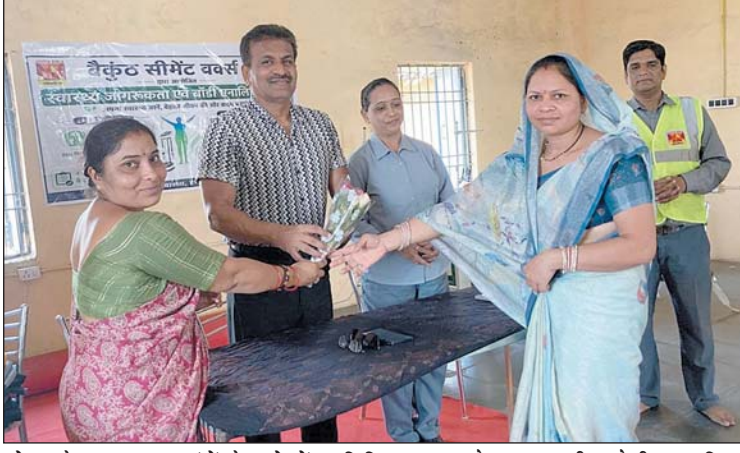
को उनके स्वास्थ्य मापदंडों के बारे में शिक्षित करना और स्वस्थ जीवनशैली

अपनाने के लिए प्रेरित करना था।बीएमआई विश्लेषण और विशेषज्ञ परामर्शशिविर के दौरान टीम ने प्रतिभागियों के बॉडी मास इंडेक्स का गहन विश्लेषण किया। यह विश्लेषण विशेष रूप से उन लोगों के लिए आयोजित किया गया था जो 'ओवरवेट' (अधिक वजन) या 'अंडरवेट' (कम वजन) की श्रेणी में आते हैं। विश्लेषण के पश्चात, प्रत्येक प्रतिभागी को उनकी शारीरिक आवश्यकताओं के अनुसार स्वास्थ्य परामर्श और डाइट