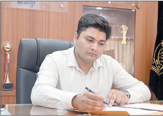
आधार पर समय-सीमा में पूर्ण करने पर जनकल्याणकारी योजनाओं का लाभ अंतिम व्यक्ति तक पहुंचाना सुनिश्चित करें।

बीजापुर 9 मई। कलेक्टर श्री विश्वदीप ने पदभार ग्रहण करने के बाद शनिवार को इन्द्रावती सभाकक्ष में जिला स्तरीय अधिकारियों की परिचयात्मक बैठक लेकर जिले के प्रशासनिक कार्यों, विभागीय योजनाओं तथा वर्तमान चुनौतियों की विस्तृत समीक्षा की। बैठक में उन्होंने शासन की महत्वाकांक्षी योजनाओं को प्राथमिकता के