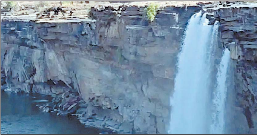
कही जाने वाली इंद्रावती नदी का भी जलस्तर कम हो रहा है। इसी नदी पर चित्रकोट वाटरफॉल बना है। अभी अप्रैल