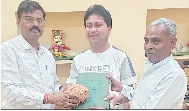
सर्वेक्षण के दौरान सन 1700 ईस्वी की लगभग 326 वर्ष पुरानी हस्तलिखित कुल 4 प्राचीन पाण्डुलिपियों का