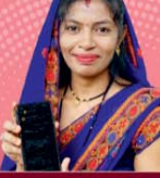
महतारी वंदन योजना 69 लाख लाभान्वित