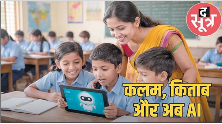
कलम, किताब और अब AI

रायपुर 8 अप्रैल। शिक्षकों को एआई टूल और सुधारात्मक विधियों का प्रशिक्षण मिलेगा। छत्तीसगढ़ के सरकारी स्कूलों में अब आर्टिफिशियल इंटेलिजेंस का उपयोग किया जाएगा। जिससे विद्यार्थियों को पठन क्षमता, लेखन और स्मरण शक्ति को बेहतर बनाने की दिशा में एक नया कदम उठाया गया है। शिक्षा विभाग ने 'दृढ़' आधारित एप्लीकेशन लागू करने की योजना बनाई है। जिसका उद्देश्य बच्चों के अध्ययन स्तर का आकलन कर उनके समस्या समाधान के लिए रणनीतियां तैयार करना है। इस पहल को राज्य स्तर पर एक कार्यशाला के दौरान साझा किया गया, जिसमें इसके रूपरेखा को निर्धारित किया गया। इस योजना की शुरुआत पायलट प्रोजेक्ट के रूप में दो जिलों में की जाएगी और इसके सफल होने के बाद इसे पूरे राज्य में लागू किया जाएगा। इसके तहत 15 जिलों से 200 घंटे का कंटेंट तैयार किया गया है। राज्य शिक्षा विभाग के अधिकारी जेपी रथ ने बताया कि यह कदम बच्चों की पठन क्षमता और समझ को बेहतर बनाने के उद्देश्य से