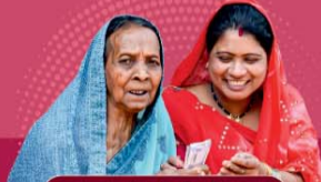
लखपति दीदी योजना 08 लाख लाभान्वित