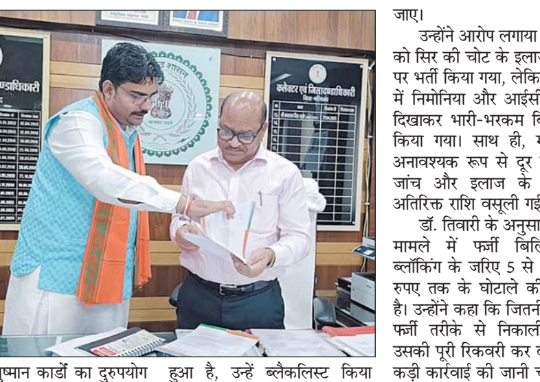
जिन आयुष्मान कार्डों का दुरुपयोग हुआ है, उन्हें ब्लैकलिस्ट किया जाए।