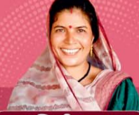
रजिस्ट्री शुल्क में 50% छूट