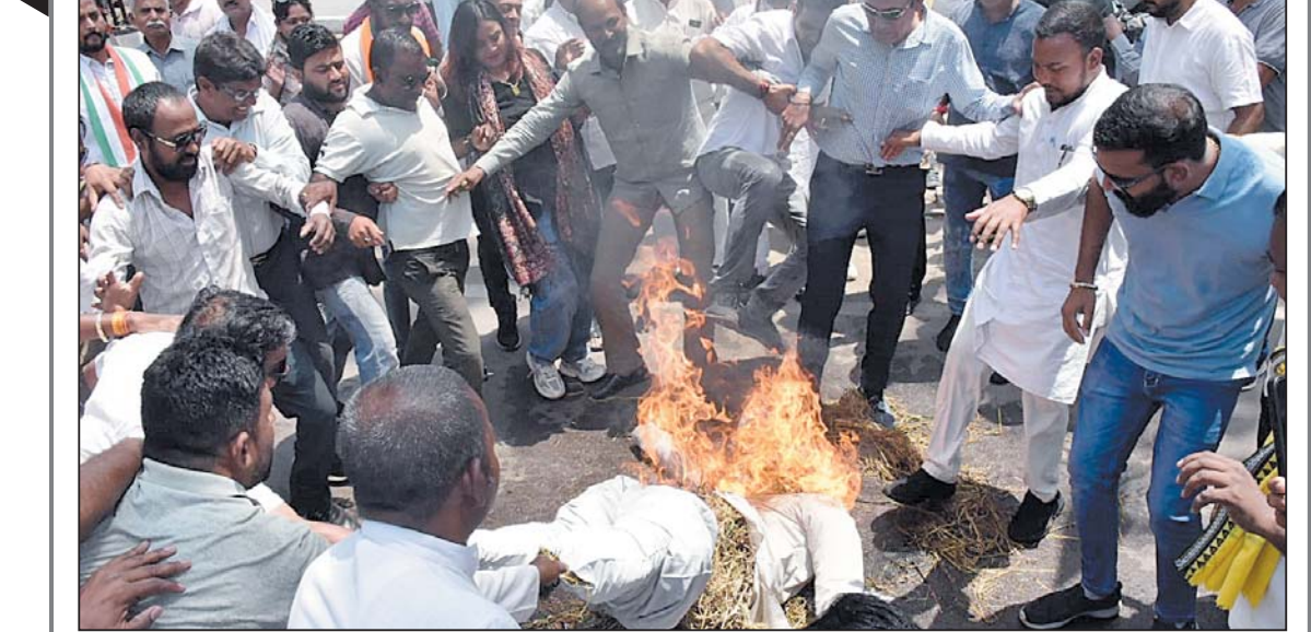
रायपुर 8 अप्रैल। अखिल भारतीय कांग्रेस कमेटी के राष्ट्रीय अध्यक्ष दलित नेता मल्लिकार्जुन खड्गे पर अभद्र भाषा का प्रयोग करने वाले असम के मुख्यमंत्री हेमंत बिस्वा सरमा का आज राजीव गांधी चौक पर पुतला दहन किया गया।