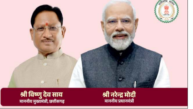
श्री विष्णु देव साय मानवीय प्रयत्नमंत्री, छत्तीसगढ़