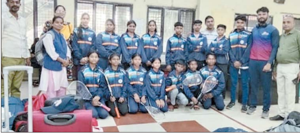
से ट्रेन द्वारा दिल्ली के लिए रवाना हुई थीं और प्रतियोगिता के समापन के पश्चात 24 अप्रैल को सकुशल वापस लौट

यह राष्ट्रीय प्रतियोगिता 16 अप्रैल 2026 से 22 अप्रैल 2026 तक दिल्ली के प्रसिद्ध त्यागराज स्टेडियम में आयोजित की गई थी। दुगली की ये होनहार बालिकाएं 14 अप्रैल को रायपुर