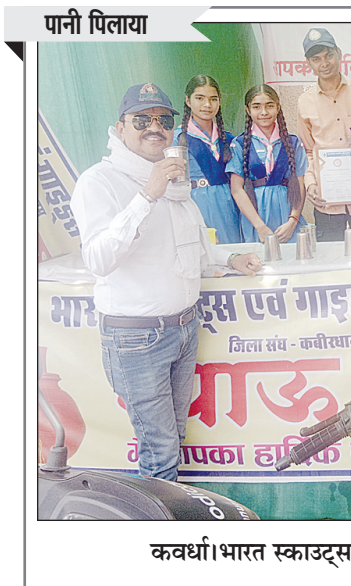
कवर्धा। भारत स्काउट्स एंड गाइड छत्तीसगढ़ ने राहगीरों को पानी पिलाया

द्वितीय तथा होली किंगडम स्कूल तृतीय स्थान पर रहे। प्रबंधन समिति के अध्यक्ष, अन्य पदाधिकारी तथा प्राचार्य ने सभी विजेताओं को बधाई देते हुए उनके उज्ज्वल भविष्य की मंगलकामना की और आशा व्यक्त किया कि विद्यार्थी गण अवश्य ही सोशल मीडिया का बेहतर ढंग से अपनी प्रतिभा के विकास में सदुपयोग करेंगे।