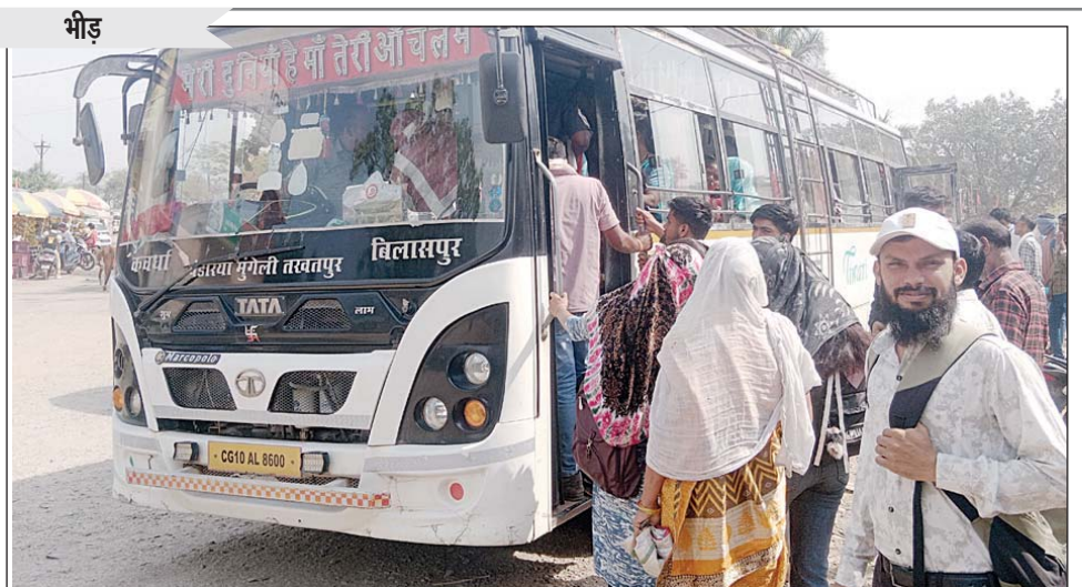
कवर्धा। शादी के कारण बसों में भारी भीड़ दिख रही है।

कुओं में ब्लीचिंग पाउडर का घोल डालकर पानी को शुद्ध किया गया। विभागीय टीम ने क्षेत्र के लगभग 125 घरों का सर्वेक्षण किया, जिसमें 35 घरों में कुएं पाए गए। सभी कुओं में जल शुद्धिकरण का कार्य किया गया। जन स्वास्थ्य विभाग की टीम ने इस दौरान नागरिकों को जल जनित बीमारियों से बचाव के लिए जागरूक किया। लोगों को सलाह दी गई कि कुएं के पानी का उपयोग केवल निस्तारी कार्यों के लिए करें तथा पीने के लिए नल के पानी को छानकर और उबालकर ही इस्तेमाल करें। साथ ही सड़े-गले फल एवं दूषित खाद्य पदार्थों के सेवन से बचने की हिदायत दी गई।