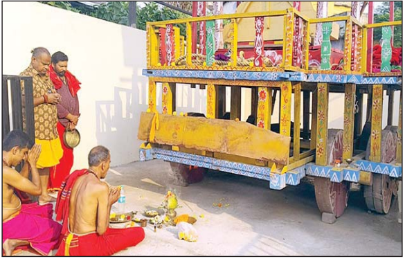
गौरतलब है कि हर वर्ष अक्षय तृतीया के शुभ दिन पर

दत्तेवाड़ा 20 अप्रैल। अक्षय तृतीया के शुभ अवसर पर जगन्नाथ मंदिर परिसर में खड़े भगवान जगन्नाथ जी की रथ की विधिवत पूजा अर्चना की गई। रथ पूजा के साथ ही आज से रथ निर्माण का कार्य भी प्रारंभ हो गया है। प्रतिवर्ष अक्षय तृतीया तिथि पर ही रथ की पूजा की जाती है। रथ पूजन के साथ ही रथ यात्रा उत्सव का आगाज भी हो जाता है।