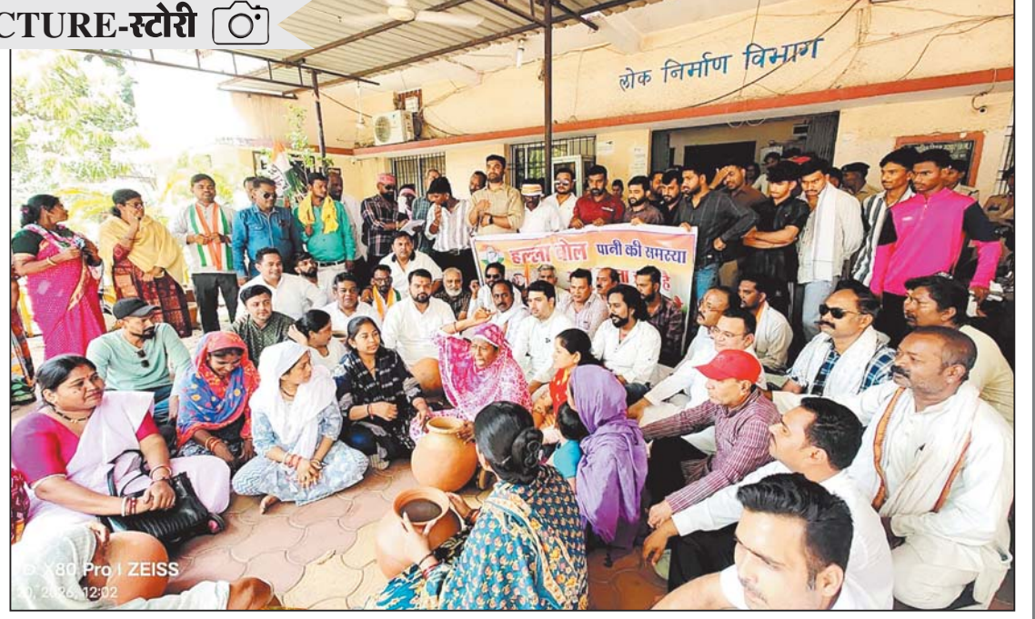
रायपुर, 20 अप्रैल। शंकर नगर इलाके में पेयजल संकट बरकरार है। इससे पीड़ित नागरिकों ने आज खाली मटका लेकर जोन कार्यालय का घेराव किया।