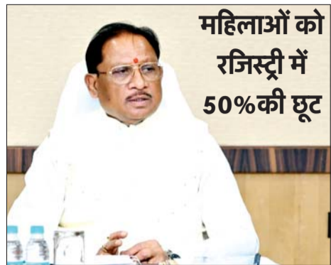
महिलाओं को रजिस्ट्री में 50%की छूट

मंत्रिपरिषद द्वारा छत्तीसगढ़ औद्योगिक भूमि एवं भवन प्रबंधन नियम, 2015 में संशोधन के प्रस्ताव का अनुमोदन किया गया। इस संशोधन से सेवा क्षेत्र को आबंटन हेतु स्पष्ट वैधानिक पात्रता मिलेगी। भूमि आवंटन प्रारंभिक अवस्था में न्यूनतम एवं अधिकतम सीमा का तार्किक सामंजस्य स्थापित होगा। लैंड बैंक भूखण्डों हेतु एप्रोच रोड का वैधानिक प्रावधान किया गया है।