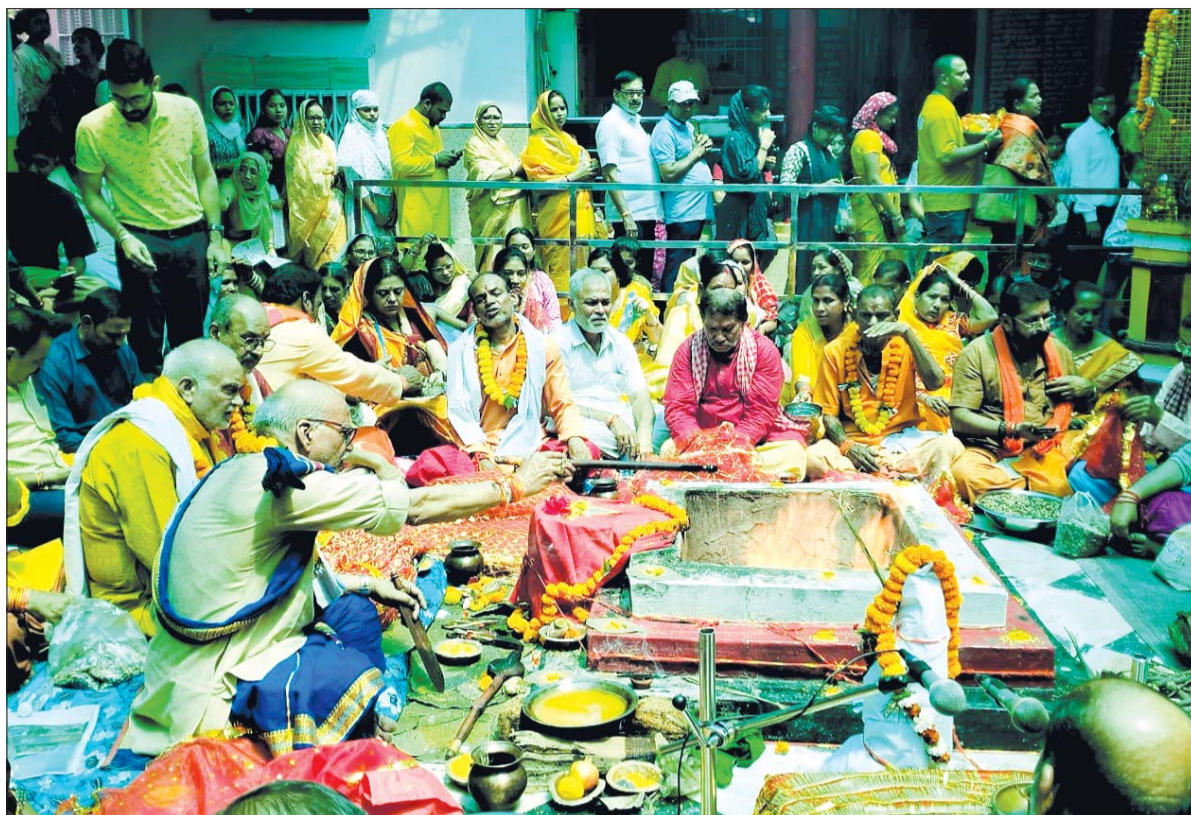
रायपुर। ऐतिहासिक महामाया मंदिर में आज अष्टमी पर हवन किया गया।

में दस्तावेज, कंप्यूटर हार्ड डिस्क, लैपटॉप और अन्य इलेक्ट्रॉनिक उपकरण जप्त किए हैं। इनमें कई संदिग्ध बिल और ट्रांजेक्शन रिकॉर्ड मिले हैं, जिनकी अब बारीकी से जांच की जा रही है। अधिकारियों के अनुसार, शुरुआती जांच में ही बड़े पैमाने पर टैक्स चोरी के संकेत मिले हैं। हालांकि, पूरे मामले का खुलासा दस्तावेजों और डिजिटल डेटा के विस्तृत विश्लेषण के बाद ही किया जाएगा। छत्तीसगढ़ जीएसटी विभाग अब टैक्स चोरी रोकने के लिए आधुनिक तकनीकों का सहारा ले रहा है। विभाग संदिग्ध लेन-देन, असामान्य बिलिंग पैटर्न और रिटर्न में गड़बड़ी पकड़ने के लिए डेटा एनालिटिक्स और सर्विलांस टूल्स का इस्तेमाल कर रहा है। इसी तकनीकी निगरानी के आधार पर इस छापेमारी की कार्रवाई की गई।