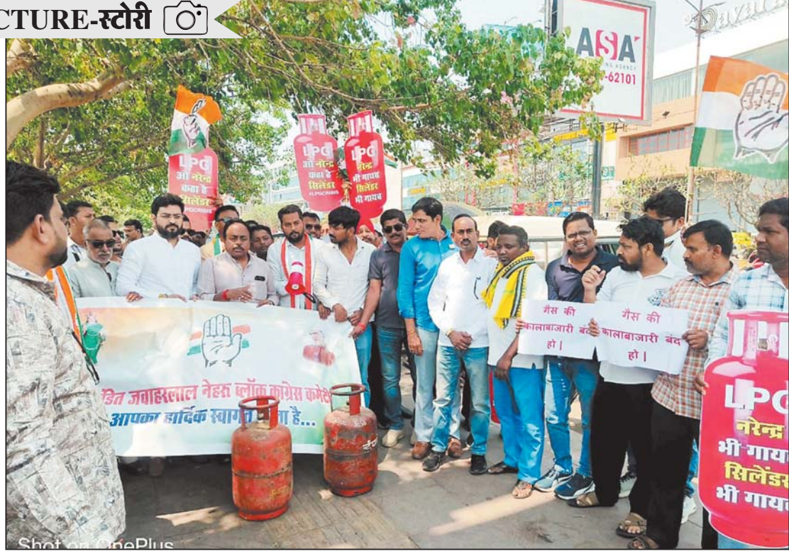
रायपुर, 24 मार्च। रसोई गैस की किल्लत के विरोध में आज शहर कांग्रेस ने प्रदर्शन किया तथा सिलेंडर के प्रतिरूप को तेलीबांधा तालाब में विसर्जित किया।