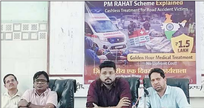
उपचार जिले के पंजीकृत समस्त शासकीय एवं निजी चिकित्सालयों में निःशुल्क उपलब्ध कराया जाएगा। कार्यशाला का लाईव प्रशिक्षण प्रोजेक्टर द्वारा प्रदान किया गया। शासन के निर्देशानुसार योजना का प्रभावी क्रियान्वयन एवं पीड़ितों

राजनांदगांव 24 मार्च। पीएम-राहत (प्रधानमंत्री रोड एक्सीडेंट विक्टिम हॉस्पिटलाइजेशन एण्ड एम्बरड ट्रीटमेंट) योजना के प्रभावी क्रियान्वयन के लिए कार्यालय मुख्य चिकित्सा एवं स्वास्थ्य अधिकारी के सभाकक्ष में जिला स्तरीय एक दिवसीय कार्यशाला का आयोजन किया गया। कार्यशाला में बताया गया कि भारत सरकार की महत्वाकांक्षी पीएम-राहत योजना के तहत सड़क दुर्घटना में घायल व्यक्ति को अब तत्काल और कैशलेस ईलाज की सुविधा मिलेगी। योजना के तहत सड़क दुर्घटना में घायल पीड़ितों को गोल्डन ऑवर अर्थात् सड़क दुर्घटना के तुरंत बाद के महत्वपूर्ण समय में बिना किसी देरी के अस्पतालों में भर्ती कर अधिकतम 7 दिनों तक प्रति व्यक्ति अधिकतम 1 लाख 50 हजार रूपए तक का कैशलेस