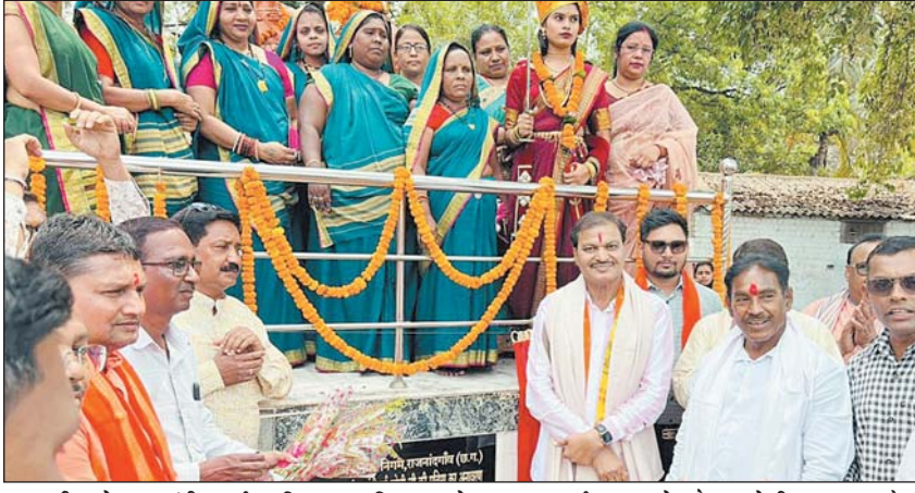
सनातनी लोग अवंती बाई बलिदान दिवस को उत्सव पूर्वक मनाते हैं लोधी समाज उनके बलिदान दिवस को