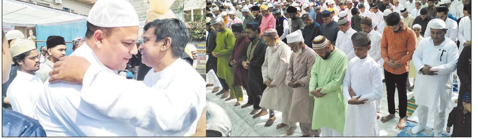
रायपुर, 21 मार्च। ईद के मौके पर लोगों ने सामूहिक नमाज पढ़ी और एक-दूसरे को गले लगाकर मुबारकबाद दी।