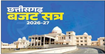
छत्तीसगढ़ बजट सत्र 2026-27