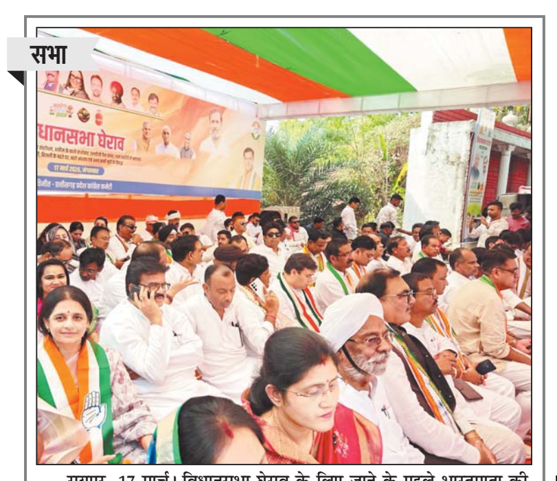
रायपुर, 17 मार्च। विधानसभा घेराव के लिए जाने के पहले भारतमाता की प्रतिमा के सामने कांग्रेसियों की सभा हुई।

कांग्रेस के भूपेश बघेल ने सहकारी समितियों में धान शर्टेज का मामला उठाया। वन मंत्री केदार कश्यप ने कहा कि रायपुर संभाग की 161 सहकारी समितियों धान का शर्टेज पाया गया है। 2026-27 में तीन राईस मिलों में एफआईआर दर्ज कराया गया है।