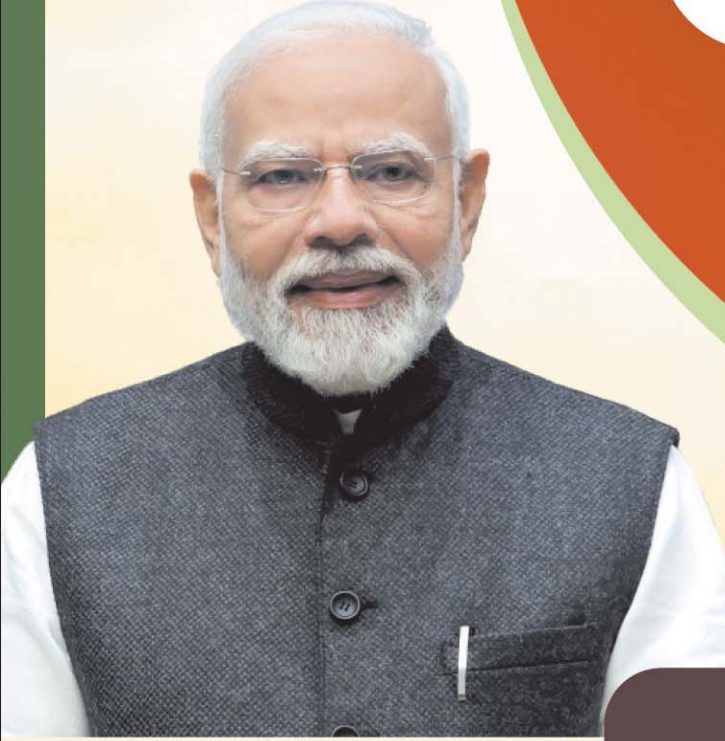
श्री नरेन्द्र मोदी माननीय प्रधानमंत्री

गौधाम लाखासार एवं गुरु घासीदास केन्द्रीय विश्वविद्यालय प्रेक्षागार, बिलासपुर (छ.ग.)