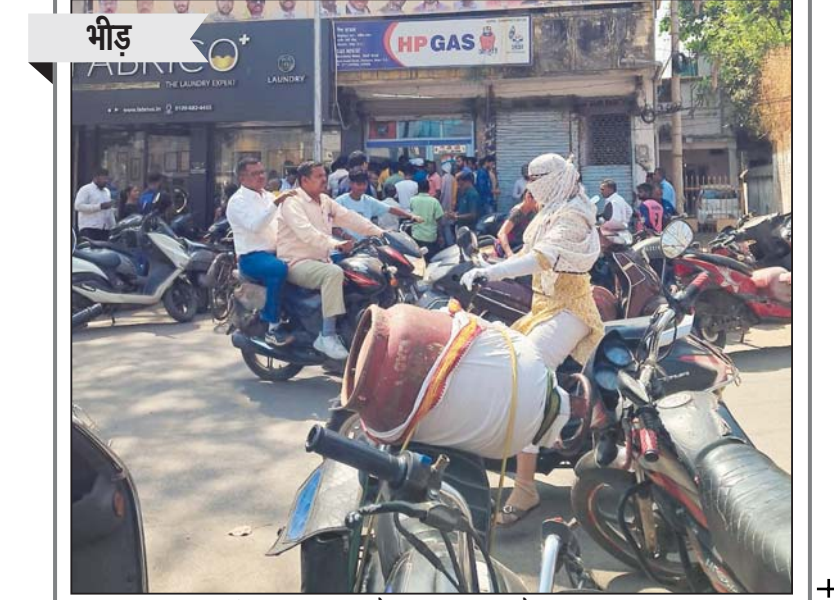
रायपुर, 12 मार्च। राजधानी की गैस एजेंसियों में गैस की किल्लत की अफवाह से सामान्य दिनों की अपेक्षा उपभोक्ताओं की ज्यादा भीड़ नजर आ रही है।