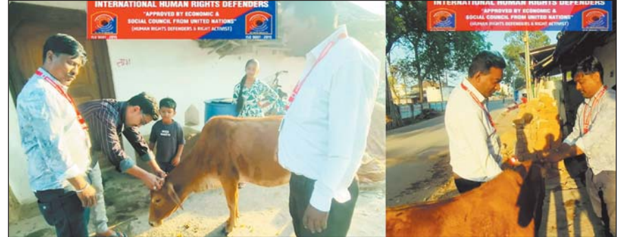
■ तरुण छत्तीसगढ़ संवाददाता

तिल्दा नेवार, 12 मार्च। अंतर्राष्ट्रीय मानव अधिकार रक्षक छत्तीसगढ़ के द्वारा गाय के सींग पर लाल रेडियम लगाए जाने का कार्यक्रम चल रहा है ताकि रात के समय सड़कों पर बैठे घुमटू पशुओं को हादसे से बचाया जा सके और वाहन चालक भी दूर से ही रेडियम की चमक से पशुओं को देख सकें और हादसे से सुरक्षित