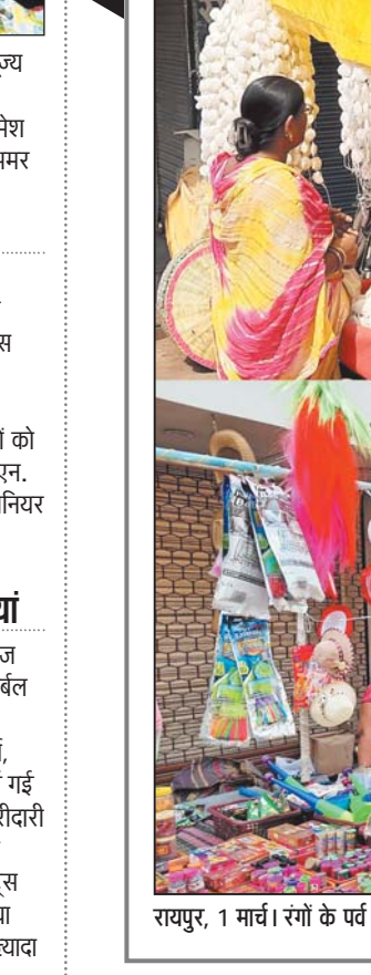
रायपुर, 1 मार्च। रंगों के पर्व होली के लिए राजधानी में दुकानें सज गई हैं।