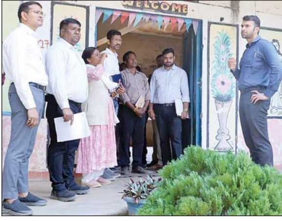
भवन की समुचित व्यवस्था सुनिश्चित की जाए।