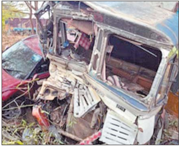
जाया गया, जबकि शव को पोस्टमार्टम के लिए भेज दिया गया। वहीं घायलों ने बताया कि वे केटरिंग का काम करने के लिए बीजापुर गए हुए थे, वहां से वापस लौटने के दौरान यह हादसा हुआ है।

ही मौत हो गई, वहीं पांच अन्य लोग घायल हो गए। दुर्घटना की सूचना पर पुलिस मौके पर पहुंच घायलों को उपचार के लिए अस्पताल ले