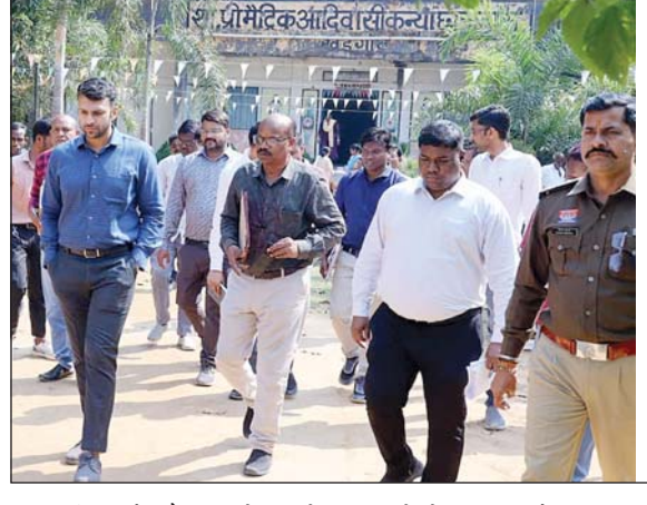
निरीक्षण के दौरान कलेक्टर ने छात्रावासों में अध्ययन के साथ-साथ

खेलकूद गतिविधियों को प्रोत्साहित करने पर विशेष जोर दिया। उन्होंने बच्चों की रुचि के अनुरूप खेल सामग्री उपलब्ध कराने के निर्देश दिए। साथ ही छात्राओं के मानसिक एवं बौद्धिक विकास के लिए लाइब्रेरी सुविधा विकसित करने, पाठ्यक्रम आधारित पुस्तकों के साथ समसामयिक विषयों पर आधारित पत्र-पत्रिकाओं की नियमित उपलब्धता सुनिश्चित करने को कहा।