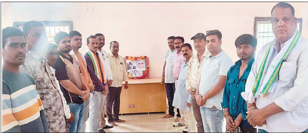
डॉक्टर खूबचंद बघेल के साथ ही उनकी माता और उनकी पत्नी भी जेल गई थीं. सन 1951 में अविभाजित मध्य प्रदेश जब हुआ करता था, तब डॉक्टर खूबचंद बघेल विधानसभा के सदस्य भी रहे. इसके साथ ही