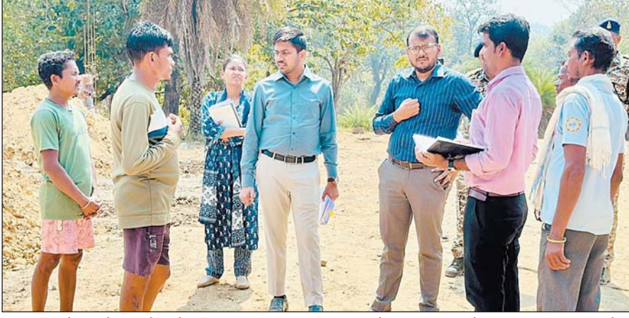
शासकीय योजनाओं एवं सेवाओं की प्रगति की समीक्षा की।

रायपुर, 23 फरवी। मुख्यमंत्री श्री विष्णुदेव साय के अंत्योदय की कल्याण एवं सुशासन की परिकल्पना को साकार करने की दिशा में सुकमा जिले में शुरू हुआ मिशन कनेक्ट का प्रभावी ढंग से क्रियान्वयन किया जा रहा है। इस पहल के माध्यम से शासन और आमजन के बीच की दूरी को कम करते हुए प्रशासनिक अमला सीधे ग्राम पंचायतों तक पहुंचकर योजनाओं के क्रियान्वयन की जमीनी स्थिति का आकलन कर रहा है। शनिवार को जिला प्रशासन द्वारा विशेष अभियान के तहत सुकमा विकासखंड की 33 ग्राम पंचायतों में एक साथ अधिकारियों ने दस्तक दी गई। कलेक्टर के नेतृत्व में जिला स्तरीय अधिकारियों ने प्रातः 10 बजे से ही निर्धारित पंचायतों में पहुंचकर विभिन्न