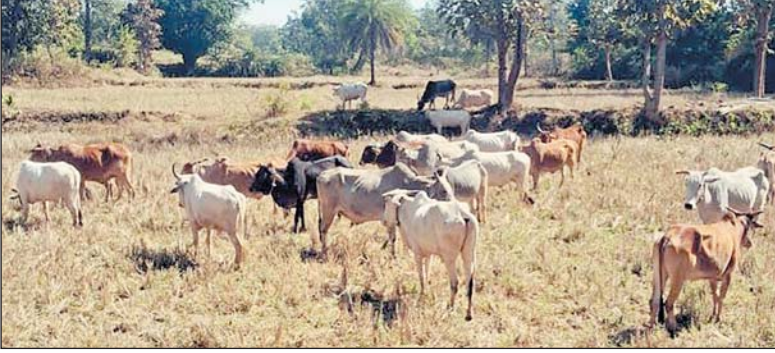
पालिका पालिका को सुपुर्द कर दिया था।

दंतेवाड़ा 19 फरवरी। बीते माह 9 जनवरी को विहिप दंतेवाड़ा के गौरक्षा दल के कार्यकर्ताओं ने गौवंशों की तस्करी होने की सूचना पर पीछा कर मटेनार से 56 गौवंशों को तस्करों से छुड़ाया था। पुलिस ने गौ तस्करों पर कारवाई करते हुए उन्हें जेल भी भेजा था। ईधर छुड़ाए गए गौवंशों को पुलिस प्रशासन ने नगर