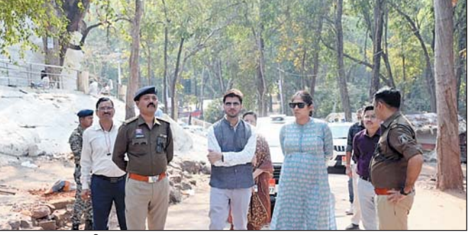
तरुण छत्तीसगढ़ संवाददाता