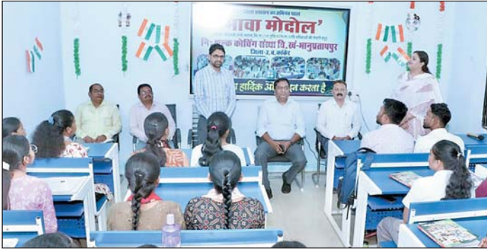
ही आवश्यक है।

विद्यार्थी मेहनत करें, सफलता का कोई शॉर्टकट नहीं होता: संभागायुक्त श्री सिंह दोपहर को विकासखण्ड मुख्यालय का भानुप्रतापपुर में स्थित मावा मोदेल निःशुल्क कोचिंग संस्था एवं हाईटेक लाइब्रेरी का अवलोकन किया। उन्होंने जिला प्रशासन की इस पहल की सराहना करते हुए दूरस्थ क्षेत्रों में निवासरत विद्यार्थियों के लिए प्रतियोगी परीक्षाओं की तैयारी हेतु बेहतर माध्यम बताया। इस दौरान श्री सिंह ने लाइब्रेरी में निवासरत विद्यार्थियों से रूबरू होकर मार्गदर्शन किया। साथ ही क्लासरूम में विद्यार्थियों को प्रोत्साहित करते हुए कहा कि वे पूरी शिद्दत से पाठ्यक्रमों पर मेहनत करें, क्योंकि सफलता का कोई शॉर्टकट नहीं होता। आज के दौर में विभिन्न सुविधाओं के साथ-साथ कॉम्पिटिशन भी बढ़ गया है। बस्तर कमिश्नर ने सभी विद्यार्थियों को अग्रिम शुभकामनाएं देते हुए कहा कि शिक्षा ही है, जो जीवन में आमूल-चूल और सकारात्मक परिवर्तन लाती है। अतः जीवन में शिक्षा बहुत