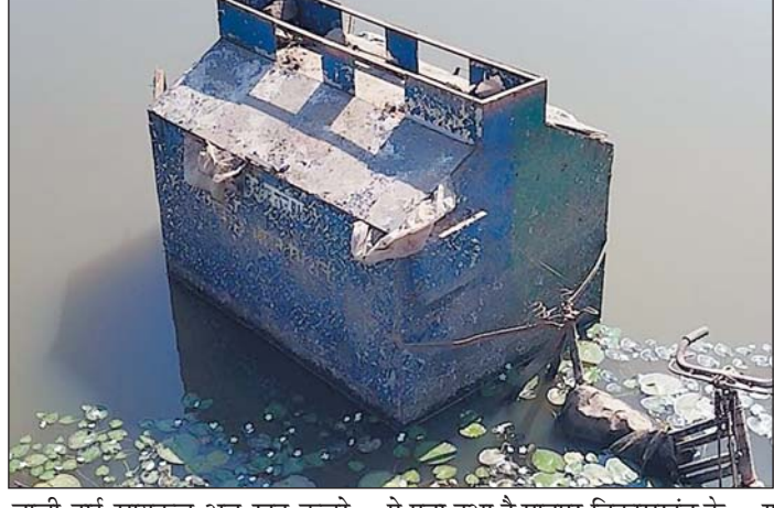
वैली ट्राई साइकल अब खुद कचरे पे पड़ा हुआ है, मानपुर विकासखंड के

मोहला 16 फरवरी। मोहला मानपुर चौकी जिले में स्वच्छ भारत मिशन पोल खोलती तस्वीरें ये बना कर रही है कि स्वच्छता जिले में अहम मायने नहीं रखती। एक साल पहले पंचायतों को मिले कचरा उठाने