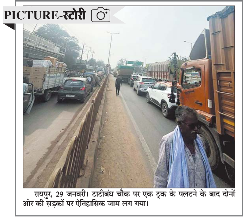
रायपुर, 29 जनवरी। टाटीबंध चौक पर एक ट्रक के पलटने के बाद दोनों ओर की सड़कों पर ऐतिहासिक जाम लग गया।