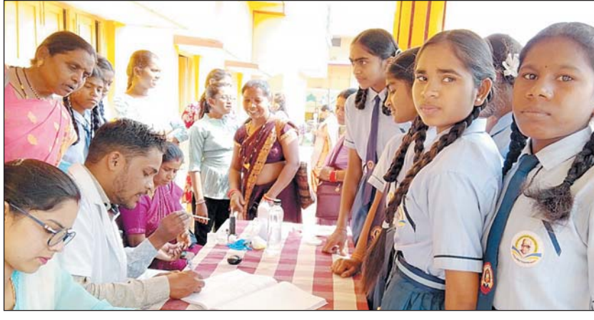
विशेष चर्चा हुई, एनीमिया के कारण, लक्षण, बचाव तथा मासिक धर्म स्वच्छता के विषय में

कार्यक्रम में महिलाओं और बालिकाओं की सुरक्षा, सम्मान एवं स्वावलंबन, लैंगिक समानता, लक्ष्य निर्धारित कर पढ़ाई पर ध्यान देना, सही पोषण के लिए संतुलित आहार, फेलिक एसिड टैबलेट, आयरन, कैल्शियम युक्त खाद्य पदार्थ पर