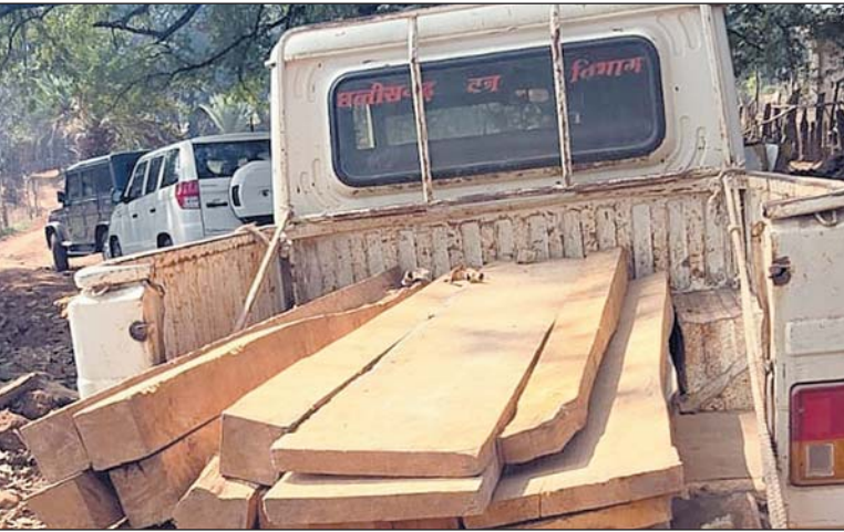
क्रम में दंतेवाड़ा वन परिक्षेत्र अंतर्गत ग्राम गढ़मिरी में गोपनीय सूचना के आधार पर बड़ी

दंतेवाड़ा 29 जनवरी। वन एवं जलवायु परिवर्तन विभाग दंतेवाड़ा द्वारा जिले में अवैध लकड़ी तस्करी पर नकेल कसने हेतु लगातार गश्त एवं सघन कार्रवाई की जा रही है। इसी