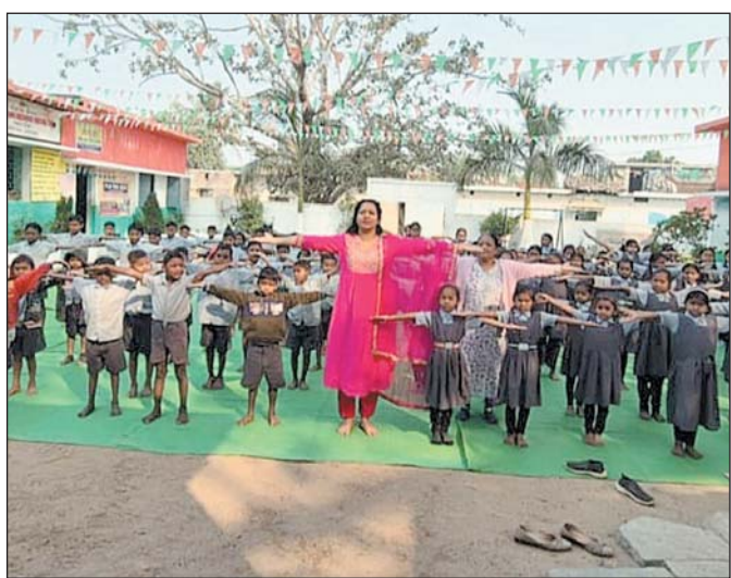
धोबनी, रावन द्वारा ग्राम रवेली एवं झीपन, दतरींगी द्वारा ग्राम सेमरिया एवं ओड़ान, देवमुन्द्रा द्वारा ग्राम खपरी एवं गाड़ाभाठा, कसडोल द्वारा ग्राम कोसमसरा एवं सेमरिया, रिकोकला द्वारा रिकोकला एवं रिकोखुर्द, परसाडीह द्वारा ग्राम कैथा एवं मड़कड़ी, टुण्डरा द्वारा ग्राम खपराडीह एवं नरधा, निपनिया के द्वारा ग्राम सेमहराडीह एवं निपनिया, सलिहा के द्वारा प्रतापगढ़ एवं डीपाडीह में योग शिविर में अधिक से अधिक संख्या में उपस्थित होकर लाभ उठा सकते हैं।

बलौदाबाजार, 29 जनवरी। आयुष विभाग द्वारा 5 दिवसीय चिन्हकित हेल्थ एंड वेलनेस सेंटर्स में योग शिविर का आयोजन 27 से 31 जनवरी 2026 तक प्रातः 7 बजे से 9 बजे तक आयोजित की जा रही है। शिविर शासकीय आयुर्वेद औषधालय खम्हरिया द्वारा ग्राम चिचोली एवं गातापार, सिरियाडीह द्वारा ग्राम सेमरिया एवं अमलीडीह, डमरू द्वारा ग्राम खरचा एवं नयापारा, मोहरा द्वारा ग्राम बरडीह एवं हिरमी, दामाखड़ा द्वारा ग्राम किरवाई एवं