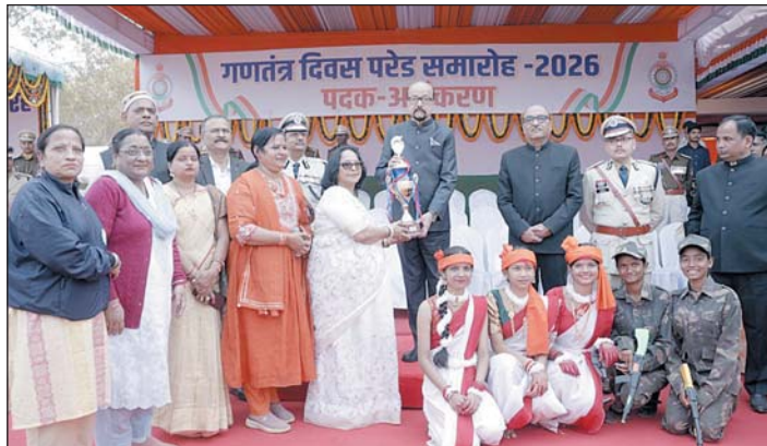
राजधानी रायपुर में हर्षोल्लास के साथ मनाया गया 77वां गणतंत्र दिवस

रायपुर, 27 जनवरी। देश के 77वें गणतंत्र दिवस के पावन अवसर पर राजधानी रायपुर के पुलिस परेड ग्राउंड में भव्य समारोह का आयोजन किया गया। राज्यपाल श्री रमन डेका ने राष्ट्रीय ध्वज फहराकर संयुक्त परेड की सलामी ली और प्रदेशवासियों को गणतंत्र दिवस की हार्दिक शुभकामनाएं दीं।