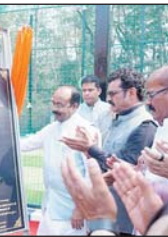
श्री आकाश छिन्कारा ने भी गेंदबाजी का उम्दा प्रदर्शन किया। उप मुख्यमंत्री श्री साव ने उत्साहपूर्वक क्रिकेट खेलकर वहां मौजूद युवाओं और नागरिकों को फिटनेस और खेलों के प्रति प्रोत्साहित किया। उप मुख्यमंत्री के इस अंदाज ने वहां उपस्थित खिलाड़ियों में नई ऊर्जा का संचार किया।

जगदलपुर 27 जनवरी। बस्तर के युवाओं और खेल प्रेमियों के लिए गणतंत्र दिवस का अवसर एक विशेष सौगात लेकर आया। उप मुख्यमंत्री अरुण साव ने सोमवार को जगदलपुर स्थित 'आमचो बस्तर वलब' में नवनिर्मित आधुनिक क्रिकेट बॉक्स यूनिट का विधिवत लोकार्पण किया। नगर पालिक निगम द्वारा जिला खनिज न्यास निधि के अंतर्गत 17 लाख 27 हजार रुपए की लागत से तैयार किया गया यह क्रिकेट बॉक्स शहर में खेल संसाधनों को और मजबूत करने की दिशा में एक अहम कदम है।