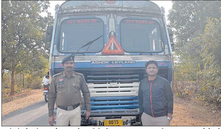
कार्रवाई की गई। इस दौरान राजडेरा समिति में 2088 कट्टा धान अधिक पाया गया, वहीं तेंदूकोना

बागबाहरा विकासखंड अंतर्गत धान उपार्जन कार्य में अनियमितताओं की जांच के तहत संयुक्त टीम द्वारा समितियों में भौतिक सत्यापन की