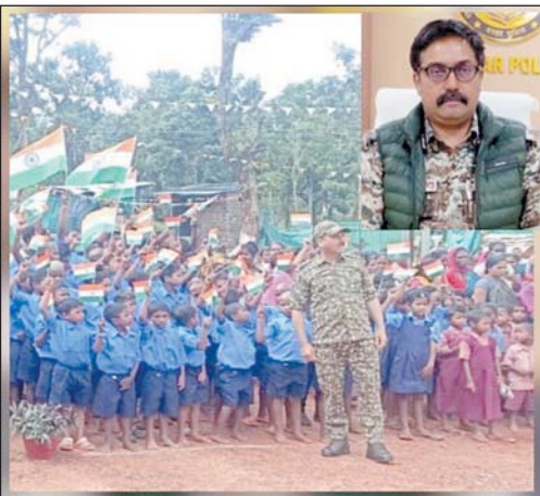
सत्ता ही स्थायी होती है। पुलिस रिकॉर्ड के अनुसार इन 41 गांवों में पहली बार ध्वजारोहण कर गणतंत्र दिवस मनाया जाएगा - जिसमें 1. उड्डूर, 2. चिलमसका, 3.पेदाकोणरा, 4. कोपागुड़ा (पीडिया), 5. बेलनार, 6. ताड़पाल, 7. कंडालापार्थी, 8. पिछूर, 9. डोडीसुमार, 10. कनालूर, 11. डोडीमरका, 12. पछेवाया, 13. सागमेटा, 14. एडजुम, 15. इदवाया, 16. आदर, 17. कुडुमेल, 18. कोंगे, 19. सिरारम, 20. तोके, 21. पटमेटा, 22. लंका, 23. परियावा, 24. कानकूर, 25. बालेबेड़ा, 26. कोडैनार, 27. अडेणार, 28. मंदोड़ा, 29. जटवर, 30. वाड़ापंदा, 31. कोडिलयार, 32.