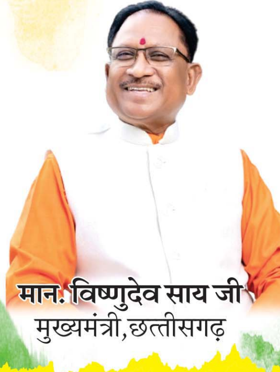
मान. विष्णुदेव साय जी मुख्यमंत्री, छत्तीसगढ़

देशवासियों को गणतंत्र दिवस की हार्दिक शुभकामनाएं