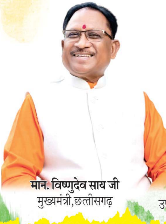
मान. विष्णुदेव साय जी मुख्यमंत्री, छत्तीसगढ़

देशवासियों को गणतंत्र दिवस की हार्दिक शुभकामनाएं