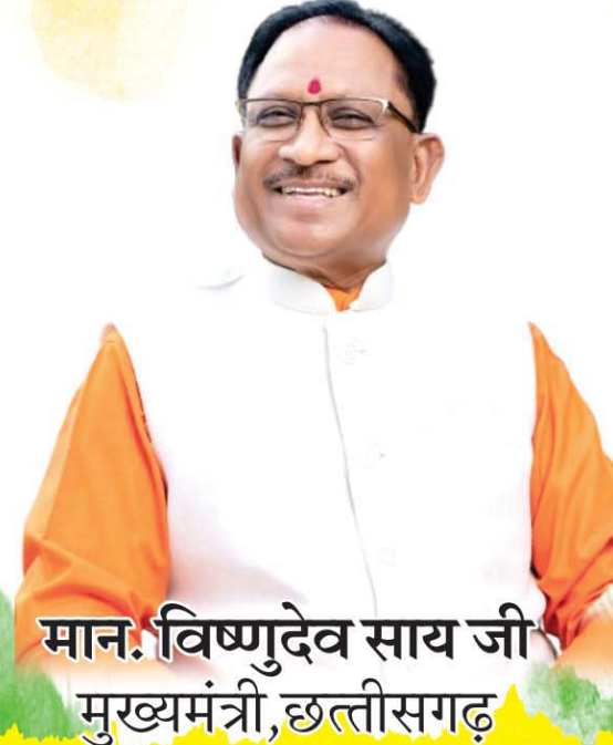
मान. विष्णुदेव साय जी मुख्यमंत्री, छत्तीसगढ़

देशवासियों को गणतंत्र दिवस की हार्दिक शुभकामनाएं