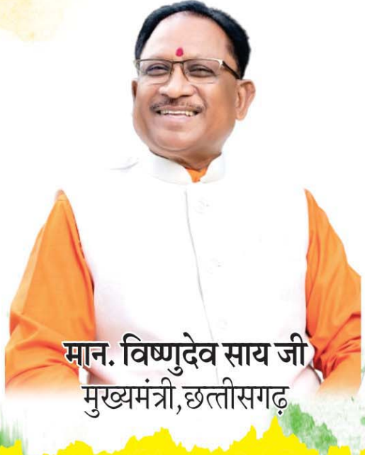
मान. विष्णुदेव साय जी मुख्यमंत्री, छत्तीसगढ़

देशवासियों को गणतंत्र दिवस की हार्दिक शुभकामनाएं