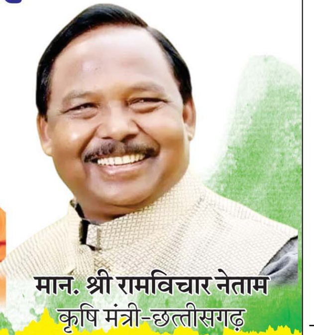
मान. श्री रामविचार नेताम कृषि मंत्री-छत्तीसगढ़