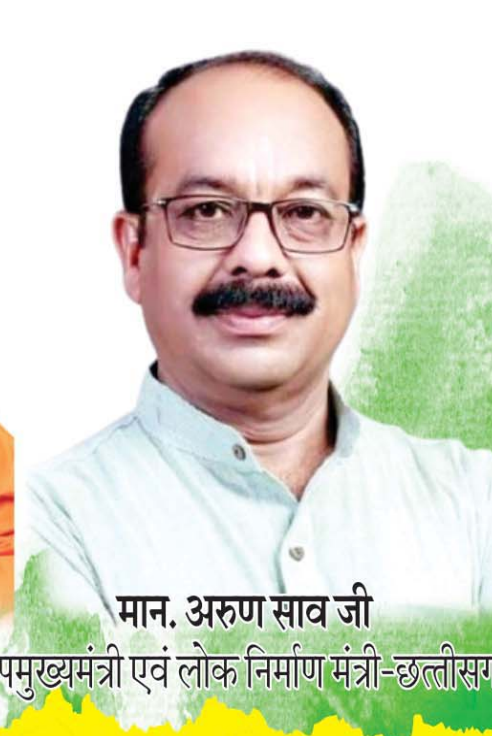
मान. अरुण साव जी उपमुख्यमंत्री एवं लोक निर्माण मंत्री-छत्तीसगढ़

लोक निर्माण विभाग बलौदाबाजार (छत्तीसगढ़)