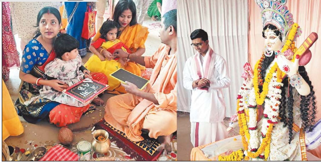
रायपुर, 23 जनवरी। बसंत पंचमी पर आज मां सरस्वती की पूजा अर्चना उपरांत पंडितों ने बच्चों के अक्षर ज्ञान का श्रीगणेश किया।