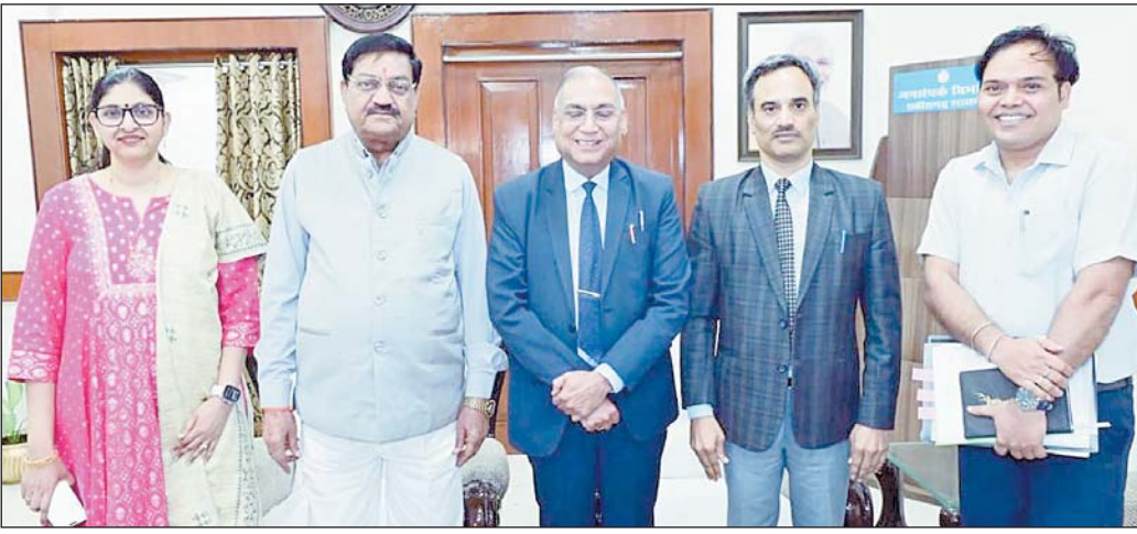
उपभोक्ता आयोगों के सुदृढ़ीकरण से संबंधित विषयों पर विस्तृत चर्चा की। उन्होंने बैठक जानकारी ली।