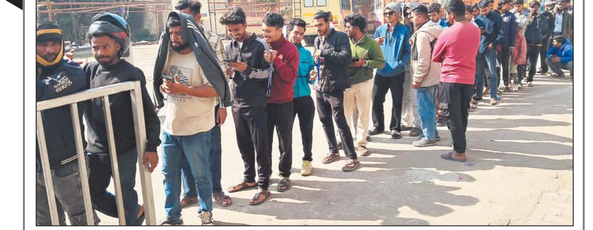
रायपुर में 23 जनवरी को होने वाले भारत-न्यूजीलैंड टी-20 मैच के लिए टिकट लेने इंडोर स्टेडियम में विद्यार्थियों की उमड़ी भीड़।