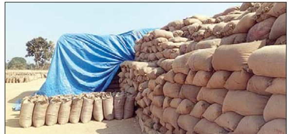
तरुण छत्तीसगढ़ संवाददाता

सरोना, 15 जनवरी। सरोना तहसील के अंतर्गत आने वाली आदिम जाति सेवा सहकारी समिति बासनवाही के धान उपार्जन केंद्र में धान का समय पर उठाव नहीं होने के कारण किसानों को भारी कठिनाइयों का सामना करना पड़ रहा है। खरीदी केंद्र में पहले से ही भंडारण की समस्या बनी हुई है, वहीं उठाव की धीमी प्रक्रिया ने हालात को और गंभीर बना दिया है।