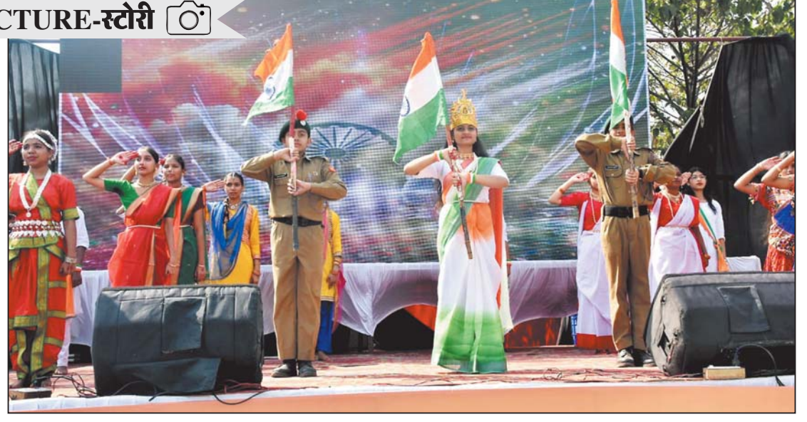
रायपुर। वंदेमातरम् की 150वीं वर्षगांठ पर आज राजधानी के सुभाष स्टेडियम में विद्यार्थियों ने वंदेमातरम् का सामूहिक गान किया।