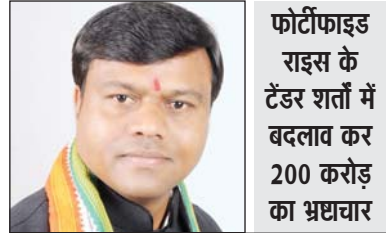
फोर्टीफाइड राइस के टैंकर शर्तों में बदलाव कर 200 करोड़ का भ्रष्टाचार

प्रदेश कांग्रेस अध्यक्ष दीपक बैज ने कहा है कि 19 दिसंबर 2025 को जारी टैंकर की शर्तों में बदलाव करते हुए भ्रष्टाचार को अंजाम देने के लिए 26 दिसंबर को नया टैंकर जारी किया गया जिसमें कई तकनीकी और वित्तीय शर्तें जोड़ी गईं, जिसकी वजह से छत्तीसगढ़ के छोटे और मध्यम एफ़फ़ारके निर्माता अयोग्य हो गए, अपने इस