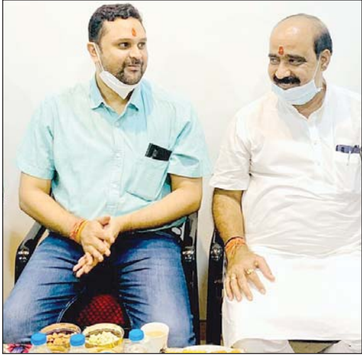
तरुण छत्तीसगढ़ संवाददाता

खरसिया, 15 जनवरी। विधानसभा क्षेत्र खरसिया शहर के कांग्रेसजनों में नई ऊर्जा एवं जान फूंकने के उद्देश्य से क्षेत्रीय