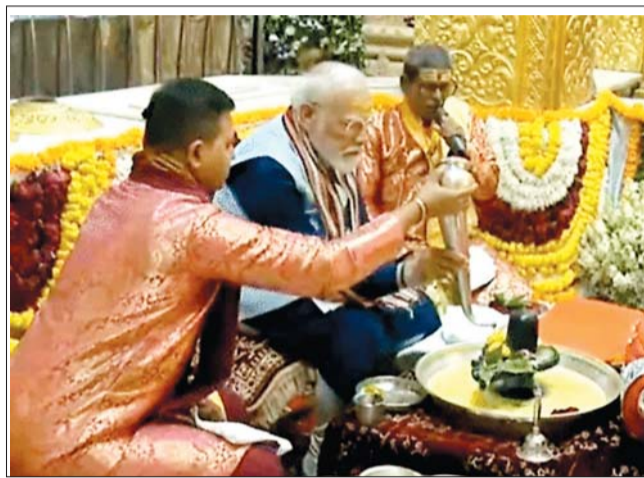
सोमनाथ के पुनर्निर्माण की शपथ ली तो उन्हें भी रोकने की कोशिश की गई। पीएम ने सद्भावना ग्राउंड में रैली को संबोधित करते हुए आगे कहा कि हमें आज भी सावधान रहना है, एकजुट रहना है। ऐसी ताकतों से सावधान रहना है, जो हमें बांटने की कोशिशों में लगी हुई हैं। प्रधानमंत्री नरेंद्र मोदी ने सोमनाथ स्वाभिमान पर्व को लेकर कहा कि

को यहां 108 अश्वों के साथ निकाली गई शीश्या यात्रा में शिरकत की। यह शोभा यात्रा सोमनाथ मंदिर की रक्षा करते हुए अपने प्राणों की आहुति देने वाले अनगिनत वीर योद्धाओं की श्रद्धांजलि अर्पित करने के उद्देश्य से निकाली गई थी, जो शौर्य, साहस और बलिदान का प्रतीक माना जाता है। इसके बाद प्रधानमंत्री मोदी ने सोमनाथ मंदिर में पूजा-अर्चना की और एक जनसभा को संबोधित किया। पहुंचे पीएम मोदी ने कहा कि 1 हजार साल पहले आतताई सोच रहे थे कि वे जीत गए हैं, लेकिन आज भी सोमनाथ मंदिर में फहरा रही ध्वजा बता रही है कि हिंदुस्तान की शक्ति क्या है। दुर्भाग्य से आज भी हमारे देश में वे ताकतें मौजूद हैं, जिन्होंने सोमनाथ के पुनर्निर्माण का विरोध किया था। जब (1951 में) सरदार पटेल ने