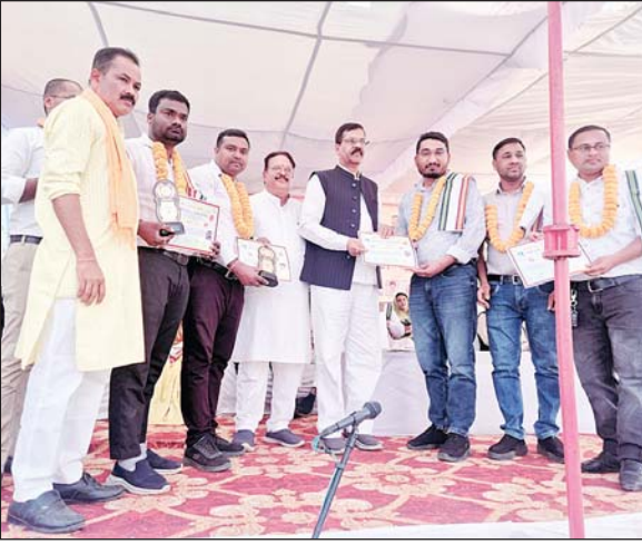
■ तरुण छत्तीसगढ़ संवाददाता

तिल्दा नेवरा, 29 दिसंबर। तिल्दा नेवरा तहसील साहू संघ एवं