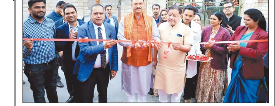
रायपुर, 14 दिसम्बर। मेडिकल कॉलेज में 120 सीटर नवीन छात्रावास का उद्घाटन तथा महाविद्यालय के नवीन प्रवेश द्वार का लोकार्पण किया गया।