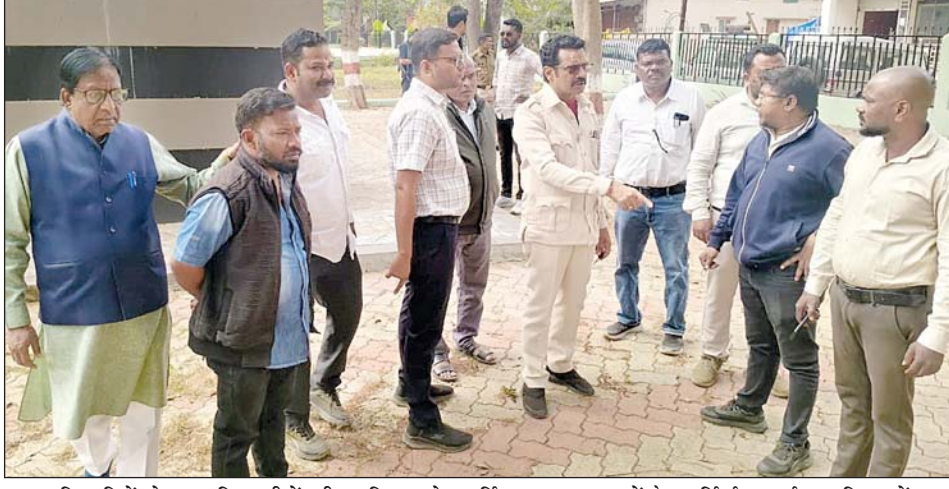
हुए अधिकारियों से कहा कि शहीदों की स्मृति को समर्पित इन पावन स्थलों के पुनर्निर्माण कार्य परिसर में अटल बिहारी वाजपेयी की प्रतिमा