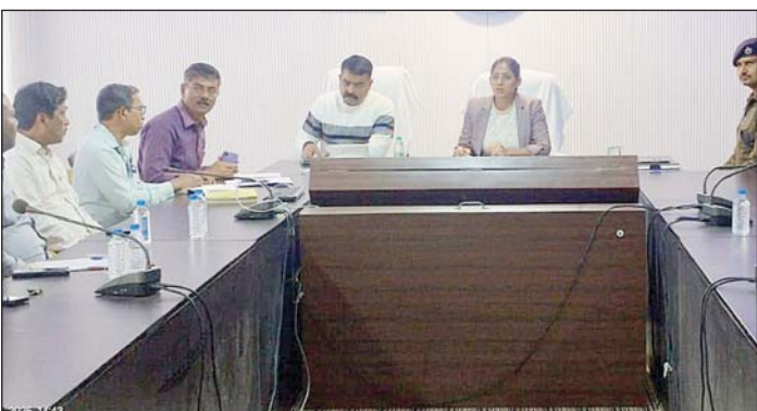
प्रबंधन का महत्वपूर्ण स्थान होता है। किसी भी प्रकरण में बैंक प्रबंधन से जानकारी विलंब से प्राप्त होने या नहीं मिलने से पीड़ित