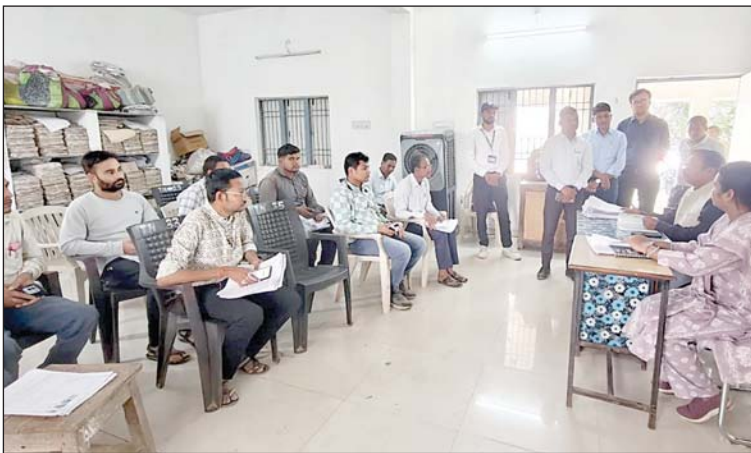
गणना पत्रक का डिजिटाइजेशन किया गया है। इसमें कसडोल विधानसभा अंतर्गत 34620 गणना पत्रक, बलौदाबाजार विधानसभा के 266338 गणना पत्रकार