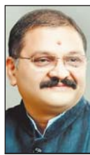
भाजपा प्रदेश प्रवक्ता व सांसद ने बिलासपुर के घटनाक्रम को लेकर कांग्रेस पर जमकर हमला बोला

गाली-गलौज से शुरू हुआ विवाद पहुंचा हत्या तक जांच में सामने आया है कि घटना से पहले मृतक नशे की हालत में था और रास्ते से गुजरते समय कुछ युवकों से उसका विवाद हो गया था। बातों