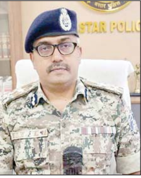
ओडिशा, आंध्रप्रदेश, तेलंगाना, महाराष्ट्र, और झारखंड के प्रभावित जिलों में शांति बहाली पर तेजी से काम हो रहा है। डेडलाइन से पहले भी बड़ी घोषणा संभव है।