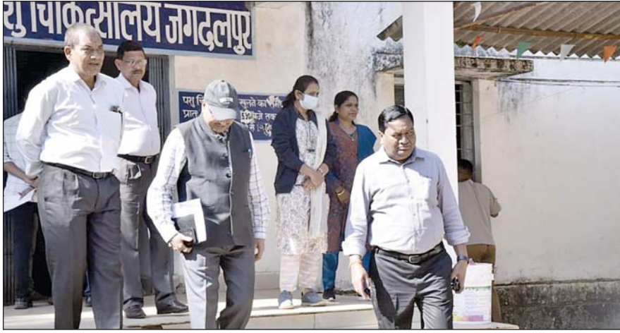
दवाइयों का क्रय किए जाने कहा। साथ ही जरूरत के अनुसार चिकित्सालय परिसर में शोड निर्माण चिकित्सा संस्थान ग्रामीण इलाकों के पशुपालकों