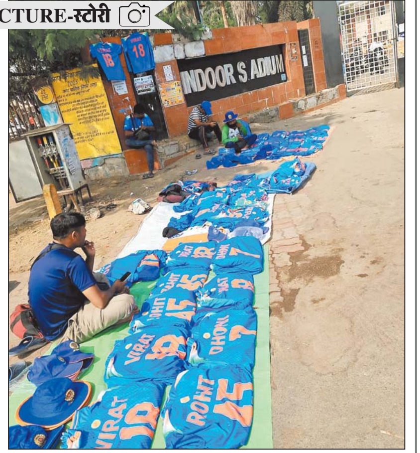
रायपुर, 28 नवम्बर। भारत-दक्षिण अफ्रीका का एक दिवसीय क्रिकेट मैच रायपुर में 3 दिसम्बर को है। टीम इंडिया की जर्सी राजधानी में जमकर कि रही है।