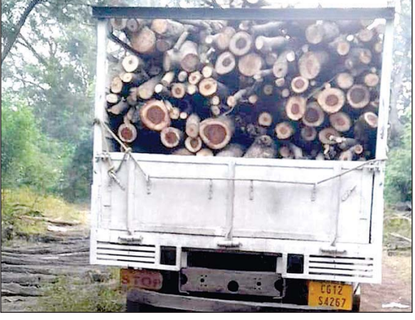
उसी रात्रि लमभग 8.30 बजे काशीराम चौक और छतामुड़ा चौक

वाहन की तलाशी में 05 जलाऊ चट्टा मिश्रित प्रजाति सरसिवा, नीम, रियां एवं जामून एवं