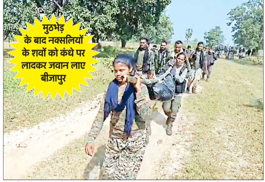
बीजापुर, 13 नवंबर। नेशनल पार्क ओनताड़ी पहाड़ी में बुधवार को सुरक्षाबल और माओवादियों के बीच मुठभेड़ हुई। इसमें मारे गए माओवादियों का शव सुरक्षाबल के जवान कंधे पर लादकर बीजापुर जिला मुख्यालय पहुंचे। पूरे वाकये का वीडियो सामने आया है।

संदिग्धों से पूछताछ में पता चला है कि उनमें से कुछ पिछले एक साल में तुर्किये भी गए थे। विस्फोटकों के भारी जखीरे की बरामदगी के सिलसिले में डॉक्टरों समेत सात लोगों को गिरफ्तार किया गया है, जबकि जांचकर्ताओं ने अब तक 'सफेदपोश आतंकी' मॉड्यूल के सिलसिले में 200 से अधिक लोगों से पूछताछ की है। इस मॉड्यूल का खुलासा आतंकवादियों के दो गुणों द्वारा दी गई सूचना के आधार पर किया गया, जिन्हें इस महीने की शुरुआत में पुलिस ने गिरफ्तार किया था। जम्मू-कश्मीर के कुलगाम में ही 200 ठिकानों पर और श्रीनगर में 150 ठिकानों पर छापेमारी की गई है। बारामूला के सोपोर में पुलिस ने 30 ठिकानों पर छापेमारी की है। एजेंसियों का कहना है कि जम्मू-कश्मीर में एक बार फिर से अतिवाद बढ़ाने के लिए जमात-ए-इस्लामी ऐक्टिव है।