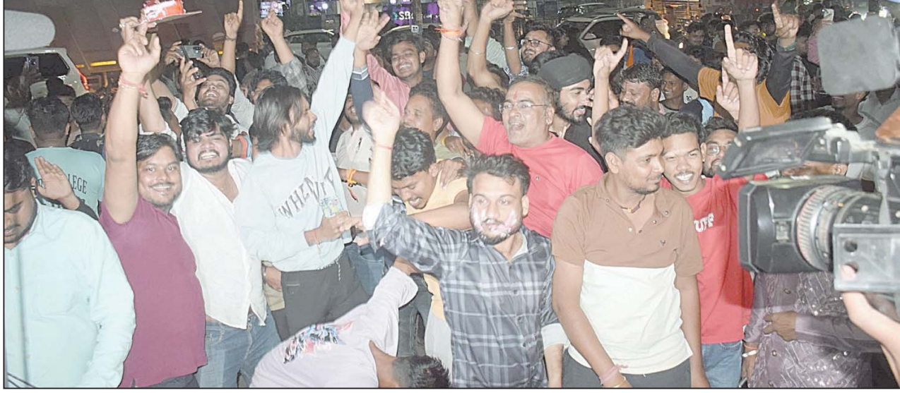
रायपुर, 3 नवंबर। भारतीय महिला क्रिकेट टीम की ऐतिहासिक जीत पर राजधानी के जयस्तंभ चौक पर मनाया गया जश्न।