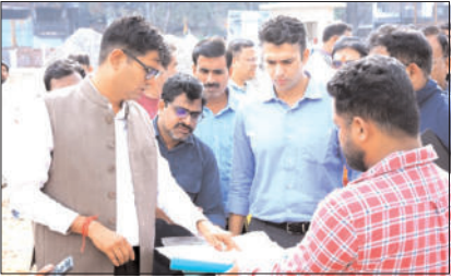
राज्य मंत्री ओ.पी. चौधरी ने रायगढ़ में चल रहे विभिन्न निर्माण कार्यों का जायजा लिया। उन्होंने अधिकारियों को गुणवत्ता और समयबद्ध कार्य सुनिश्चित करने के सख्त निर्देश दिए।

वित्त मंत्री श्री चौधरी ने सबसे पहले रायगढ़ विकास क्षेत्र की ओ.पी. चौधरी ने आज सुबह रायगढ़ शहर में चल रहे विभिन्न निर्माण कार्यों और बुनियादी ढांचे परियोजनाओं का निरीक्षण किया। इस दौरान उन्होंने अधिकारियों को गुणवत्ता और समयबद्ध कार्य सुनिश्चित करने के सख्त निर्देश दिए।