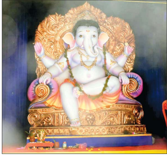
श्री नवयुवक संगठन गणेशोत्सव समिति, राजीव गांधी चौक, छोटपारा