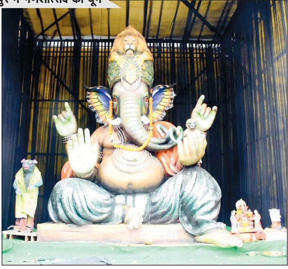
श्री बालाजी परिवार गणेश उत्सव समिति, बूढापारा