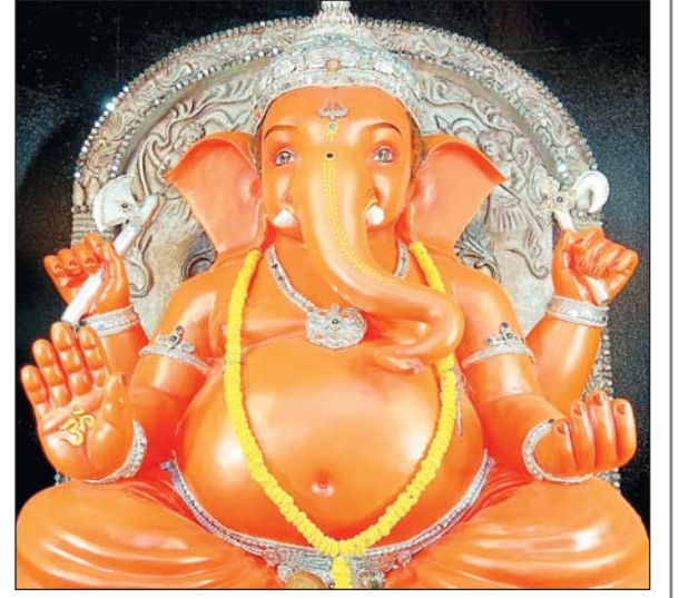
श्री क्रांति संघ गणेशोत्सव समिति, पुरानी बस्ती थाना के सामने, कंकाली नाका चौक