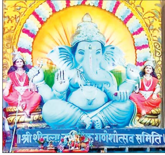
श्री शीतला नवयुवक गणेशोत्सव समिति, मटपारा