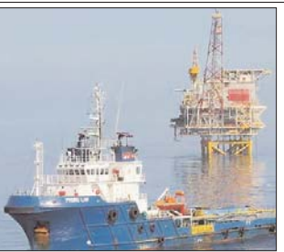
को जाएगी जो भूवैज्ञानिक समझ को बढ़ाएगी और आर्थिक हार्डवेयरबन धनता को उभार करेगी, जिससे

की खोज में बीपी का अनुभव, स्ट्रैटेजिक डिग्गिंग के लिए कुओं को डिजाइन और स्थान निर्धारण में बहुत सहायक होगा। समझौते के तहत, ओएनपीसी निवेश करेगी, जबकि बीपी निवेशदाता उपदान करेगी। स्ट्रैटेजिक डिग्गिंग अमरटीय बेसिन के भूविज्ञान को समझने और संभावित हार्डवेयरबन संसाधनों की पहचान करने पर केंद्रित होगा, जिसका उद्देश्य मॉड्यूल में तेल और गैस खोजने के लिए किया जा सकता है। डिग्गिंग में ऊर्जा वाले 2025 कार्यक्रम के दौरान केंद्रीय निवेश एवं प्राकृतिक गैस मंत्रालय हार्दिक सिंह पुरी को अध्यक्षित में इस समझौते आगम पर हस्ताक्षर किए गए थे। केंद्रीय मंत्री ने हाल ही में अंडमान और निकोबार बेसिन के