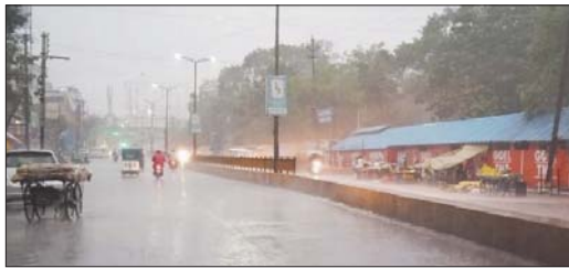
मौंटिक पश्चिम बंगाल के तटीय इलाके, उत्तर उड़ीसा और उत्तर पश्चिम बंगाल को खाड़ी के ऊपर एक निम्न दाब का प्रभाव है। इस क्षेत्रों में बलो अलर्ट जारी किया गया है।

बारिश के लिए अर्ध-अनुमानित जारी किया है। उत्तर बस्तर कोंकण, धमारी, बलौदा, राजनांदगांव, गरियाबंद, महामसूर, राजपुर, बलौदा बाजार, रायगढ़, विलासपुर, दुर्ग, बेमेगा, सूरजपुर, कोरिया, बलसमूर में सेषमन्त्रि, आकाशीय बिजली और अचानक तेज हवा के साथ मध्यम वर्षा की संभावना है। इन जगहों पर अर्ध-अनुमानित जारी किया है। इसके अलावा कोंडगांव, उत्तर बस्तर कोंकण, धमारी, बलौदा, राजनांदगांव, गरियाबंद, महामसूर, बलौदा बाजार, जॉर्जपुर, चांग, रायगढ़, विलासपुर, कोरिया, जरापुर, गौरल-पंज-मरावडी, बेमेगा, कर्बीमाम, मुंगेली, सुरुजपुर, सूरजपुर, कोरिया, बलसमूर में मध्यम वर्षा हो सकती है। इन क्षेत्रों में बलो अलर्ट जारी किया गया है। मौसम विभाग ने जानकारी दी कि