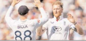
बरीर और विल डेविस के रूप में दो स्पेशलिस्ट विमरस को भी शामिल किया गया है। ओली पोप ने पहले ही टीम में जगह बना ली है लेकिन उनका नंबर-3 का खेल प्लान मुश्किल माना जा रहा है। युवा बल्लेबाज

खिलाफ न्यूजीलैंड में होने वाली वनडे और टी-20 सीरीज के लिए भी इंग्लैंड की टीम घोषित कर दी गई है। ऑस्ट्रेलिया जाने से पहले इंग्लैंड की टीम न्यूजीलैंड जाएगी। वहां 18 अक्टूबर से नवंबर तक इंग्लैंड को तीन वनडे और तीन टी-20 मैच खेलने हैं। इंग्लैंड की टीम में 6 तेज गेंदबाज शामिल हैं। जोष आंचरं पूरी तरह फिट हैं और वे इंग्लैंड के पेंस अटैक को लीड करेंगे। उनके अलावा ब्रायड कास्ट, गस स्ट्रैकिंगन, मैथ्यू पार्कर, जोना टॉग, मार्क वुड और खुद कप्तान स्टोक्स टीम के अन्य तेज गेंदबाज हैं। पूरी तरह फिट नहीं होने की वजह से किस बोक्सबाइर हो गए हैं। शोएव