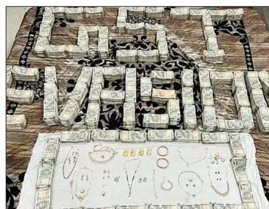
जाजिए क्या है पूरा मामला

822 करोड़ रुपए के ई-वे बिल जनरेट किए गए जांच के मुताबिक सिर्फ 26 फर्मों से ही 822 करोड़ रुपए के ई-वे बिल जनरेट किए गए, जबकि रिटर्न में महज 106 करोड़ का टर्नओवर दिखाया गया।