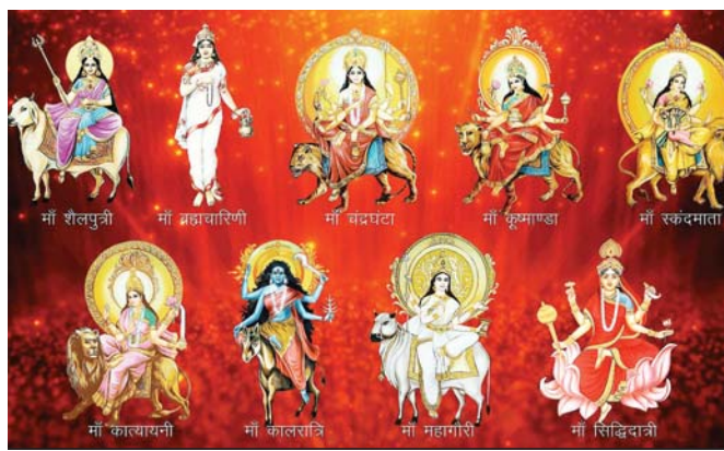
ज्योति कलश की स्थापना मध्याह्न 11.30 बजे से लेकर 12.24 के मध्य की जाएगी। आश्विन शुक्ल मंगलवार 23 सितंबर को द्वितीया तथा 24 को तृतीया

रायपुर, 20 सितंबर। राजधानी सहित प्रदेश में शक्ति की भक्ति 22 से की जाएगी। राजधानी के प्रख्यात महामाया देवी मंदिर सार्वजनिक न्यास ने करीब 11 हजार तथा रतनपुर महामाया मंदिर में करीब 15 हजार तथा डोंगरगढ़ में हजारों की संख्या में दीप प्रज्वलित करने के लिए भक्तों में होड़ मची हुई है। राजधानी के प्रमुख चौक चौराहों तथा अन्य स्थानों में भी माता की प्रतिमा लाई जा रही है। यहां पर आकर्षक मंच बनाये जा रहा है। मिली जानकारी के अनुसार महामाया देवी मंदिर सार्वजनिक न्यास द्वारा महामाया मंदिर की आकर्षक साज सजा की जा रही है। मंदिर के न्यास द्वारा मिली जानकारी के अनुसार प्रतिपदा