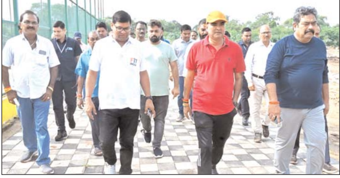
आकाशगंगा सुपेला सब्जी मंडी को परेशानी के कारण नया स्थान पर संकरी जगह पर होने से लोगों को हो रही स्थानांतरित करने का निर्णय लिया गया।

भिलाई, 14 सितंबर। नगर पालिक निगम भिलाई के जोन क्रमांक-1 नेहरू नगर क्षेत्र में विधायक रिकेश सेन, महापौर नीरज पाल और आयुक्त राजीव कुमार पाण्डेय ने संयुक्त निरीक्षण किया। इस दौरान नवनिर्मित बैडमिंटन कोर्ट, आकाशगंगा सुपेला सब्जी मंडी, नेहरू नगर स्थित स्लाटर हाउस और सुपेला थाना के पीछे अवैध सामाजिक भवन का अवलोकन किया गया। निरीक्षण के दौरान नवनिर्मित बैडमिंटन कोर्ट में बरसात के पानी की निकासी की व्यवस्था सुधारने और उखड़े पेंवर ब्लॉक बदलने के निर्देश दिए गए। वहीं