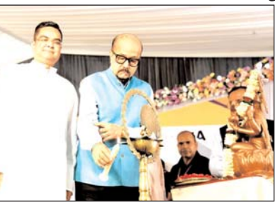
एक डिग्री ही नहीं होगी, बल्कि आपके पास का एक आदर्श उदाहरण है कि कैसे तकनीक का उपयोग सामाजिक लाभ के लिए किया जा सकता है। ड्रोन केवल उड़ने वाले उपकरण नहीं हैं, वे ऐसे उपकरण हैं जो कृषि, आपदा प्रबंधन, स्वास्थ्य सेवा वितरण और पर्यावरण निगरानी में क्रांति ला सकते हैं। जब आप इस प्रयोगशाला में प्रयोग और नवाचार करते हैं, तो याद रखें कि प्रत्येक परियोजना में जीवन को प्रभावित करने और समुदायों को बदलने की क्षमता है। राज्यपाल ने कहा कि यहाँ की ड्रोन प्रयोगशाला इस बात का एक आदर्श उदाहरण है कि कैसे तकनीक का उपयोग सामाजिक लाभ के लिए किया जा सकता है। ड्रोन केवल उड़ने वाले उपकरण नहीं हैं, वे ऐसे उपकरण हैं जो कृषि, आपदा प्रबंधन, स्वास्थ्य सेवा वितरण और पर्यावरण निगरानी में क्रांति ला