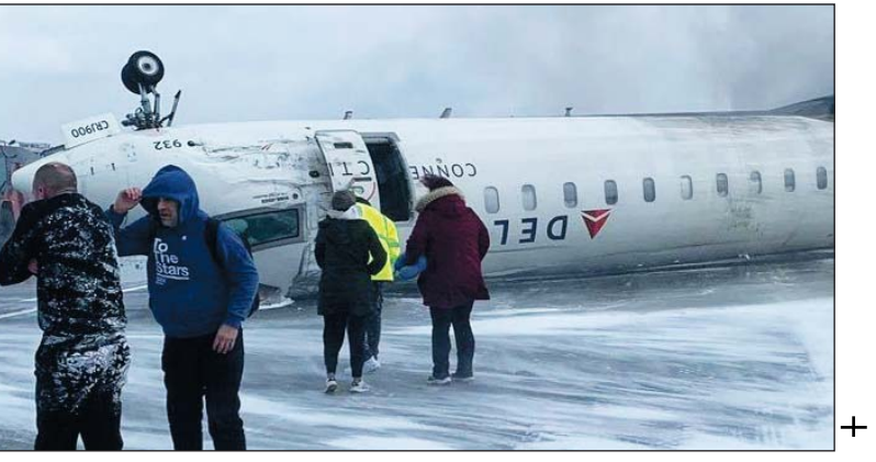
विमान को एंजवर एयर की तरफ से डेल्टा ब्रांड के तहत ऑपरेट किया गया था। हालांकि, टोरंटो पियर्सन में लैंडिंग के दौरान, विमान कंट्रोल खो बैठा और पलट गया। आपातकालीन टीमों तुरंत घटनास्थल पर पहुंची और सभी यात्रियों को विमान से सुरक्षित निकाल लिया गया। हादसे के बाद टोरंटो एयरपोर्ट ने 200 से ज्यादा उड़ानों पर अस्थायी रूप से रोक दी गई थी, लेकिन कुछ ही घंटों के बाद उड़ानों का संचालन फिर से शुरू कर दिया गया था।

टोरंटो, 18 फरवरी। कनाडा में बड़ा विमान हादसा हुआ है। डेल्टा एयरलाइंस की फ्लाइट टोरंटो पियर्सन एयरपोर्ट पर लैंडिंग के समय दुर्घटना का शिकार हो गई। विमान काफी दूर तक फिसलने के बाद पलट गई। हादसे के समय विमान में 80 लोग सवार थे, जिसमें 76 यात्री और 4 चालक दल के सदस्य थे। इसमें 18 लोग घायल हो गए, जिनमें 2 की हालत गंभीर बताई जा रही है। फ्लाइट मिनिगोपॉलिस-सेंट पॉल एयरपोर्ट से टोरंटो पियर्सन अंतर्राष्ट्रीय हवाई अड्डे की ओर जा रही थी। हालांकि, टोरंटो पियर्सन एयरपोर्ट पर लैंडिंग के समय दुर्घटना का शिकार हो गई। हादसे के बाद घटनास्थल से कुछ वीडियो सामने आए हैं, जिसमें मित्सुबिशी CRJ-900LR विमान को बर्फीली सड़क पर उड़ता पड़ा दिखाया गया है, जबकि आपातकालीन कर्मचारी इसे पानी से धो रहे हैं। टोरंटो में आए शौकतकालीन तूफान से बर्फ के कारण विमान कुछ हद तक छिप गया था। अधिकारियों के अनुसार, इस