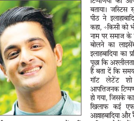
आप गुलाबहाटी जाकर अपना बचाव क्यों नहीं करते? पीठ ने अत्यधिक असहमति जताते हुए कहा, -आपने (इलाहाबादिया) जो शब्द चुने हैं।

क्या आपको अपनी गंदी मानसिकता को बाहर निकालने के लिए कुछ भी कहने का लाइसेंस है?