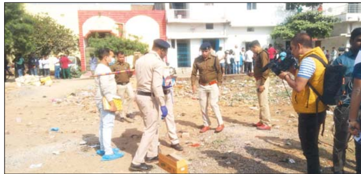
रायपुर, 31 दिसंबर

बजरंग दल के खंड संयोजक समेत दो युवकों की हत्या, 6 आरोपी गिरफ्तार