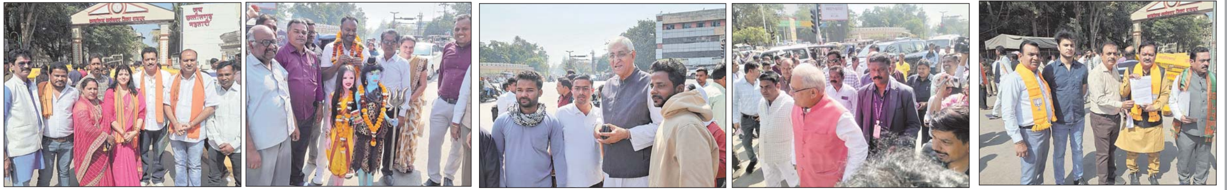
रायपुर 28 जनवरी। नगरीय निकाय चुनाव के लिए नामांकन दाखिल करने के आज अंतिम दिन विभिन्न वार्डों से दलों के अधिकृत प्रत्याशियों व बड़ी संख्या में निर्दलियों ने नामांकनपत्र दाखिल किया।