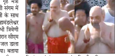
क 'महकुंभ' सनातन संस्कृति की अविरल धारा का अद्वितीय प्रतीक है। कुंभ समरसता पर आधारित

प्रयागराज 27 जनवरी। केंद्रीय गृह मंत्री अमित शाह ने साधु-संतों के साथ त्रिवेणी संगम में आस्था की डुबकी लगाई। केंद्रीय गृहमंत्री के साथ मुख्यमंत्री योगी, जून अखाड़े के महामंडलेश्वर अवधेशानंद गिरि और बाबा रामदेव ने भी त्रिवेणी संगम में आस्था की डुबकी लगाई। इस दौरान सांघम योगी और साधु-संतों ने अमित शाह पर जल डाला और सभी ने मां गंगा का आशीर्वाद लिया। बताया जा रहा है कि आज गृहमंत्री तकरीबन 5 घंटे तक महकुंभ क्षेत्र में रहेंगे। केंद्रीय गृह मंत्री शाह ने कहा