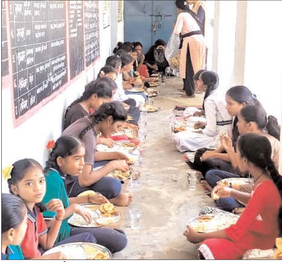
तरुण छत्तीसगढ़ संवाददाता

बीजापुर, 12 जनवरी | मुख्यमंत्री श्री विष्णुदेव