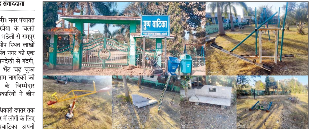
ऐसा नजारा नगर के गार्डन में कभी आम हुआ करता था। आज यहां की स्थिति बद्दहाल है। इतना सब होने के बावजूद अधिकारी आंख बंद कर बैठे हुए हैं। प्रतिदिन आने वाले नागरिकों की संख्या में भी कमी होती नजर आ रही है। लोगों ने बताया कि पहले गार्डन की स्थिति सही रहता था तो दिनभर खुला रहता था लेकिन अब नगर पंचायत अपनी अव्यवस्था पर पर्दा डालने के लिए सुबह और शाम को कुछ घंटों के लिए खुला

उल्लेखनीय है कि प्राकृतिक वातावरण, और शाम को कुछ घंटों के लिए खुला