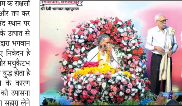
नारायण करते हैं वही भगवती के द्वारा भगवान शंकर, विष्णु एवं ब्रम्हा को स्त्रीयों प्राप्त हुई जिनकी महागौरी, महालक्ष्मी एवं

से जन्म लेने वाले मधु कैटभ नाम के राक्षसों के द्वारा भगवती की उपासना और तप कर अपनी इच्छा और अपने मनपसंद स्थान पर मरने का वरदान मांगते हैं जिसके उपास से घबराये देवताओं और ब्रम्हा के द्वारा भगवान नारायण से उसके वध के लिए निवेदन है जिसके बाद भगवान नारायण और मधुकैटम राक्षसों के बीच हजारों वर्षों तक युद्ध होता है लेकिन मधुकैटम के न मरने के कारण भगवान नारायण देवी भगवती की उपासना करते हैं जिसके बाद चतुर्गर्ह का सहाय लेने के लिए देवी भगवती कहती हैं जिसके बाद अपने चतुर्गर्ह की सहायता से भगवती के शक्ति से उन राक्षसों का वध भगवान