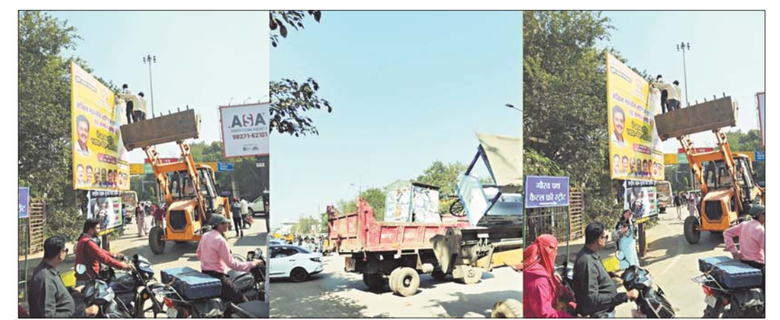
रायपुर 8 जनवरी। राजधानी में लगातार नगर-निगम की कार्रवाई जारी है, इसी कड़ी में आज पचपट्टी नाका जीएएसटी भवन और पोस्ट ऑफिस के बाहर नगर निगम ने अवैध कब्जों पर बुलडोजर चलाकर कार्रवाई की है। इस इस दौरान पान टेली और गुमटियों को नगर निगम ने तोड़ा है।