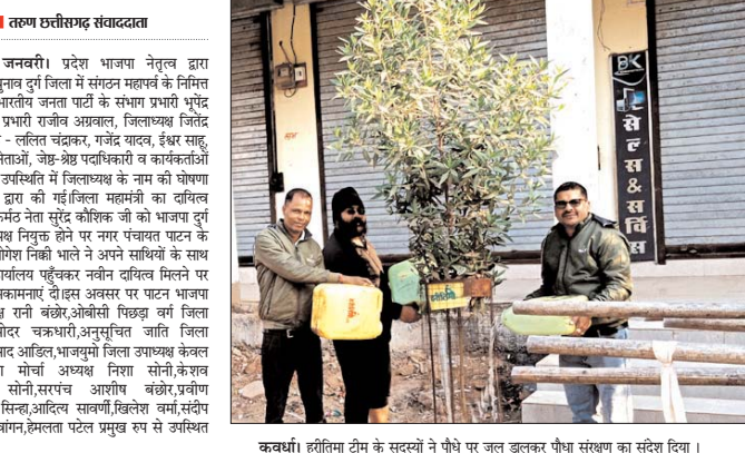
कवर्धा। हरितामा टोम के सदस्यों ने पौधे पर जल डालकर पौधा संरक्षण का संदेश दिया।