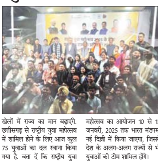
छत्तीसगढ़ से राष्ट्रीय युवा महोत्सव में शामिल होने के लिए आज कुल 75 युवाओं का दल रवाना किया गया है। बता दें कि राष्ट्रीय युवा महोत्सव का आयोजन 10 से 12 जनवरी, 2025 तक भारत मंडलम, नई दिल्ली में किया जाएगा, जिसमें देश के अलग-अलग राज्यों से भी युवाओं की टीम शामिल होंगे।

रायपुर 8 जनवरी। छत्तीसगढ़ राज्य के 75 युवाओं का दल आज राष्ट्रीय युवा महोत्सव में भाग लेने के लिए रवाना किया गया। इस अवसर पर मुख्यमंत्री विष्णुदेव साय ने प्रतिनिधि मंडल को बधाई दी, उन्होंने कहा कि प्रधानमंत्री नरेंद्र मोदी का संकल्प है कि भारत को 2047 तक विकसित भारत बनाया है, हमें प्रदेश को भी विकसित बनाना है। आप सभी लोग इस महोत्सव में भाग लेना जा रहे हैं। आप सभी को बधाई और शुभकामनाएं। वहीं खेल मंत्री टंकराम वर्मा ने युवाओं को संबोधित करते हुए कहा कि हमारी जो कहकहा है 'छत्तीसगढ़िया सयलें बढिया' उसे चरितार्थ करेंगे, सभी